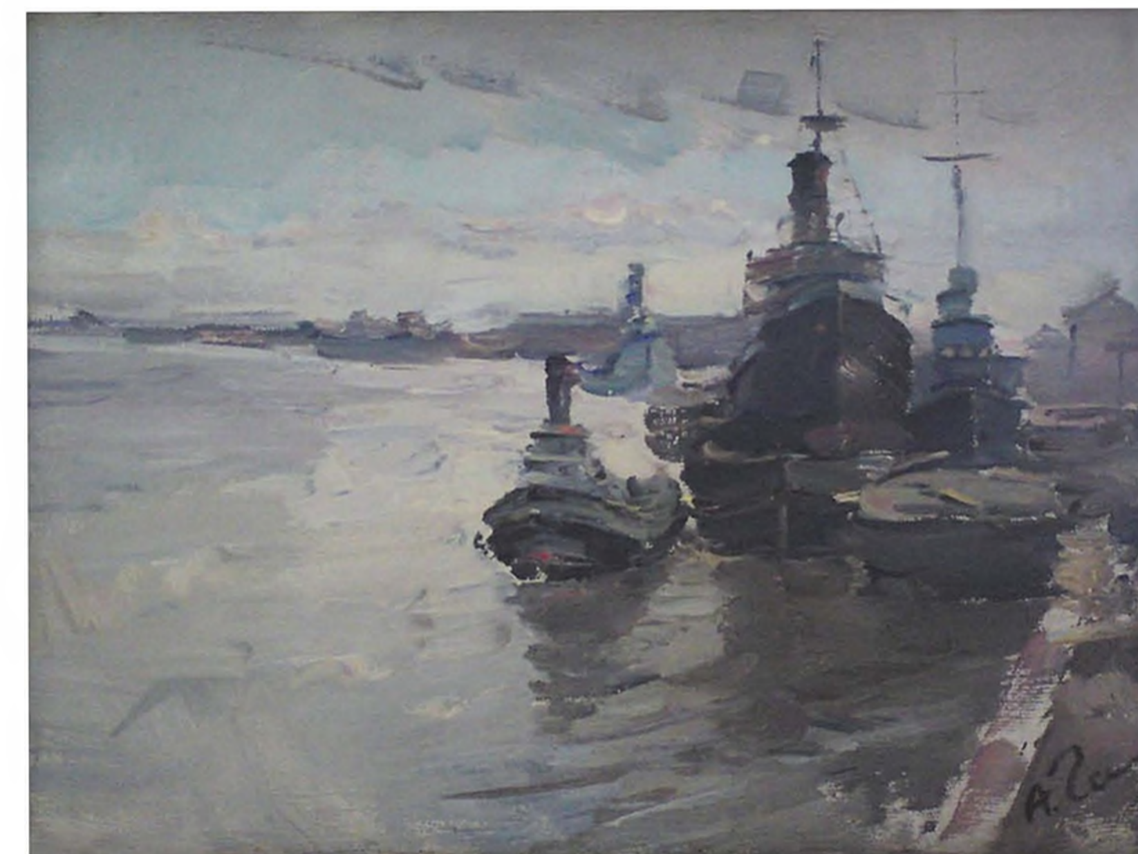
А.С. Чеснокова. Вид на Неву с Мытнинской набережной. 1946. Х., м. 58x67