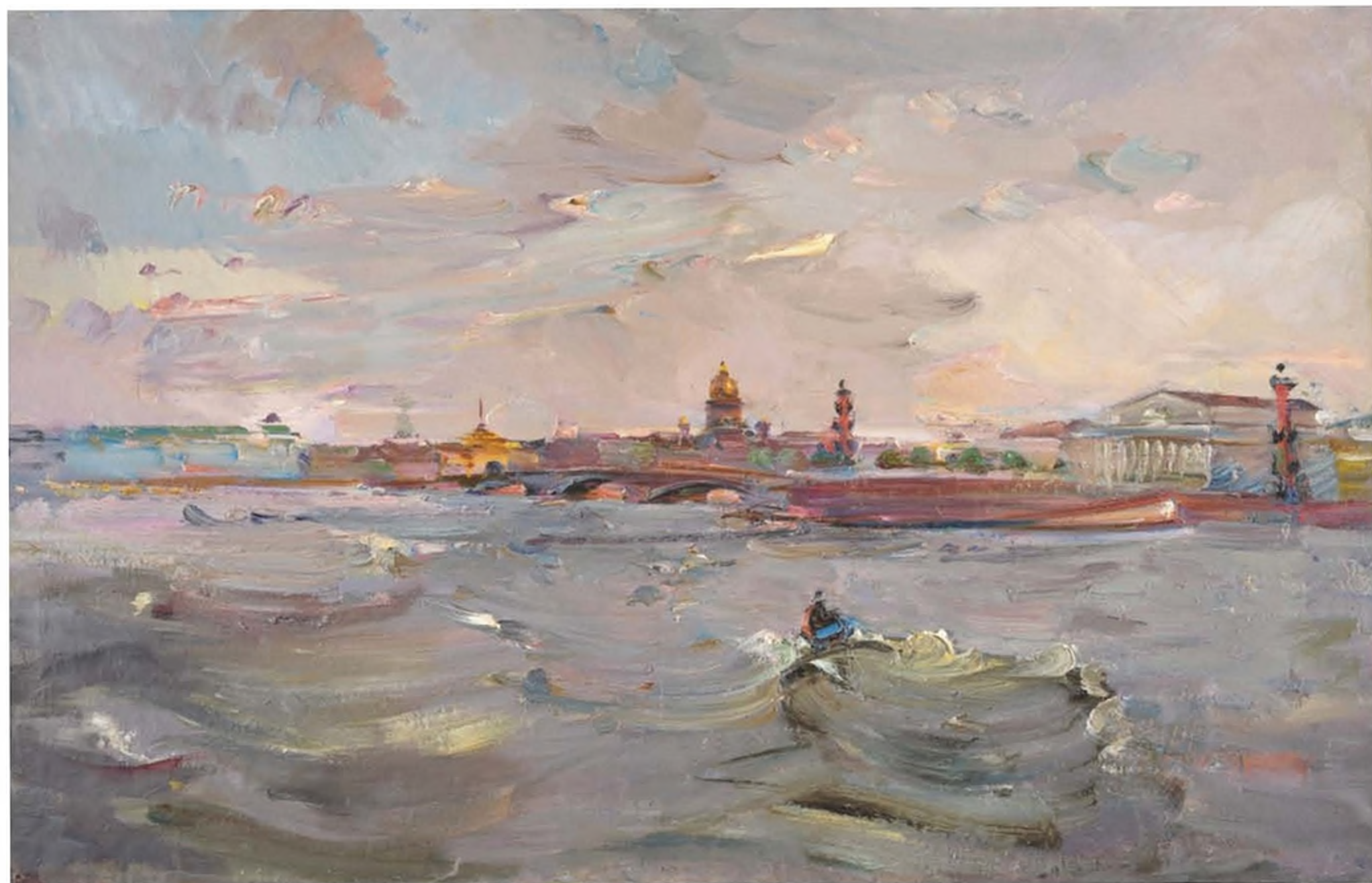
А.С. Чеснокова. Нева. Вид на Стрелку. 1979. Х., м. 72x114. Государственный Русский музей