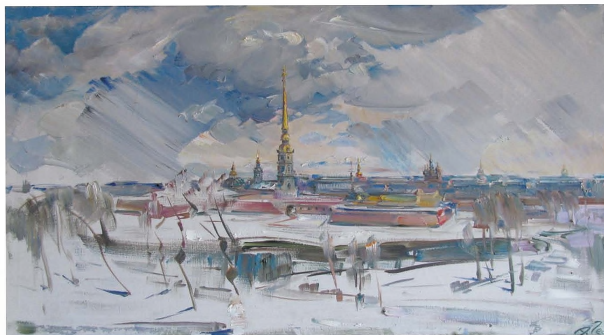
А.С. Чеснокова. Петропавловская крепость. 1976. Х., м. 50x90