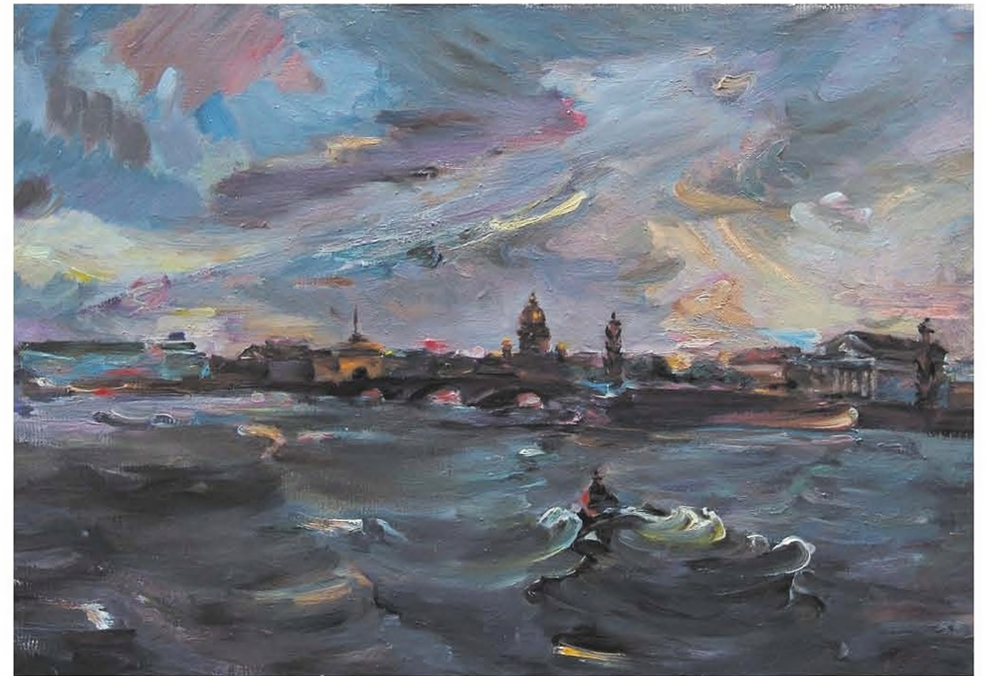
А.С. Чеснокова. Ветреный день на Неве. 1980. Х., м. 51x72