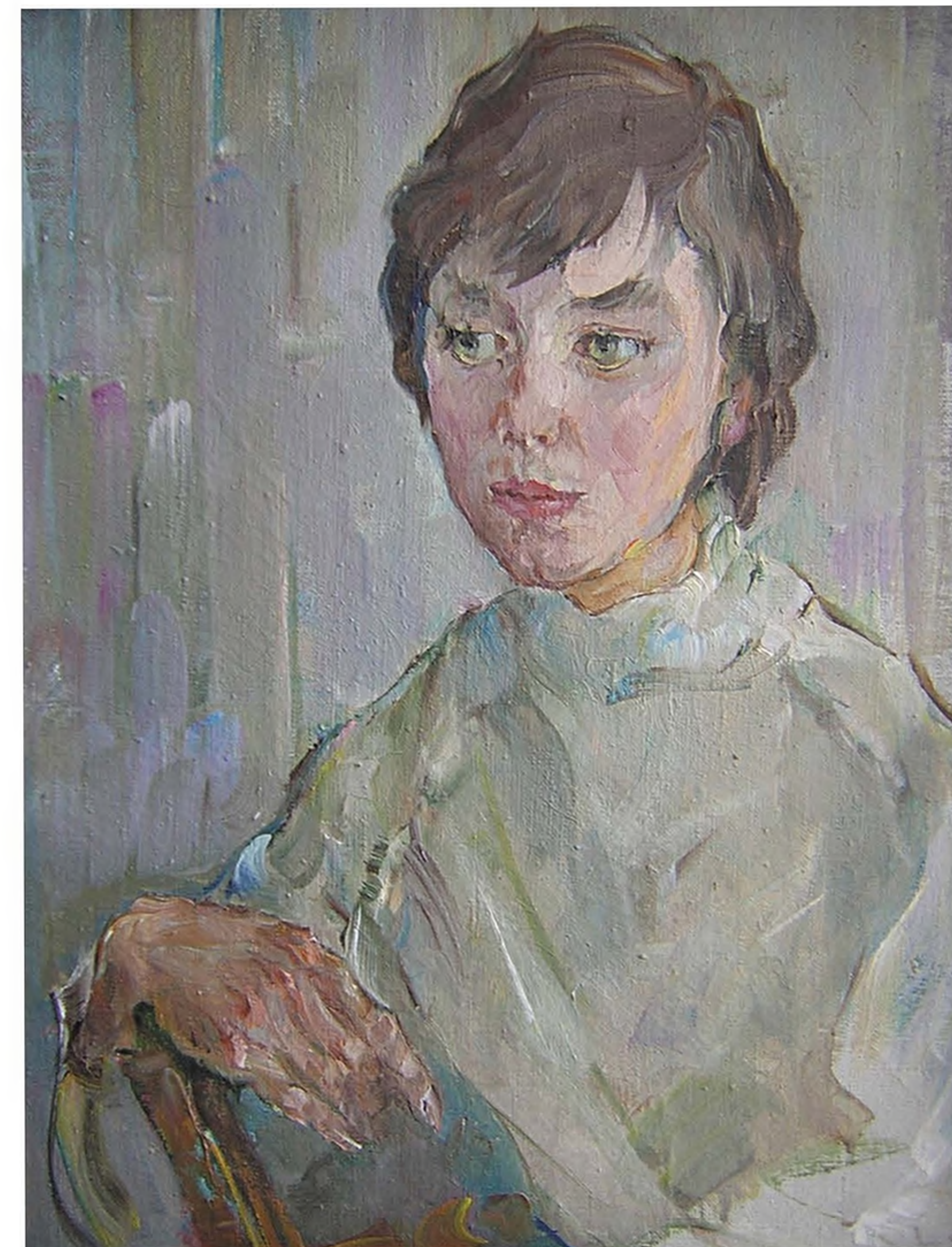
А.С. Чеснокова. Портрет внука Алексея. 1980. Х., м. 50x38

Творчество А.С. Чесноковой в 80-е годы. Последний период творчества А.С. Чесноковой – поиск новых выразительных средств: размашистость мазка, рваная линия, необычные цветовые отношения. Это естественный и закономерный этап развития манеры письма, последовательный шаг в развитии творчества.