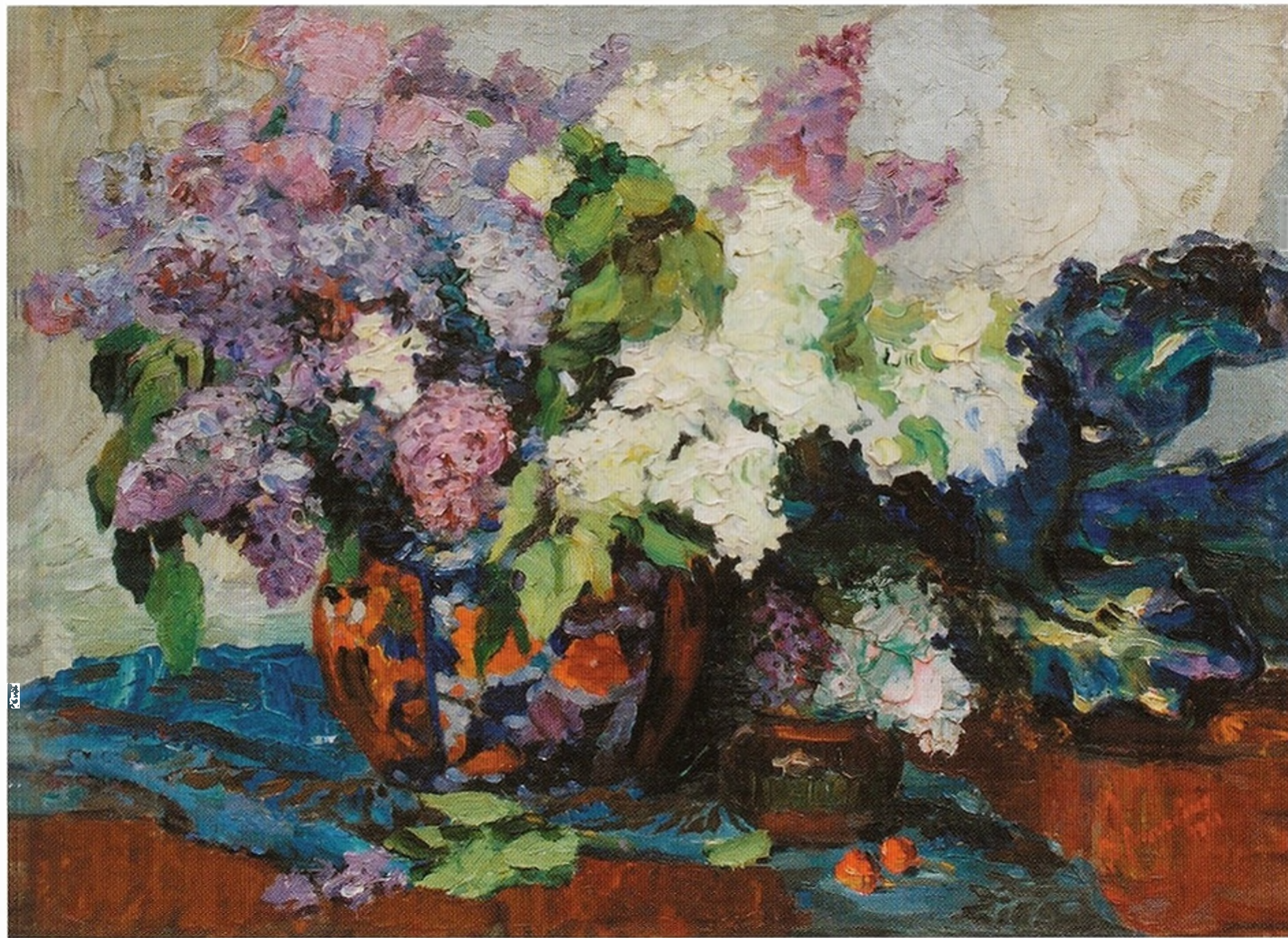
В.Л. Анисович. Сирень. 1961. Х., м. 55x75