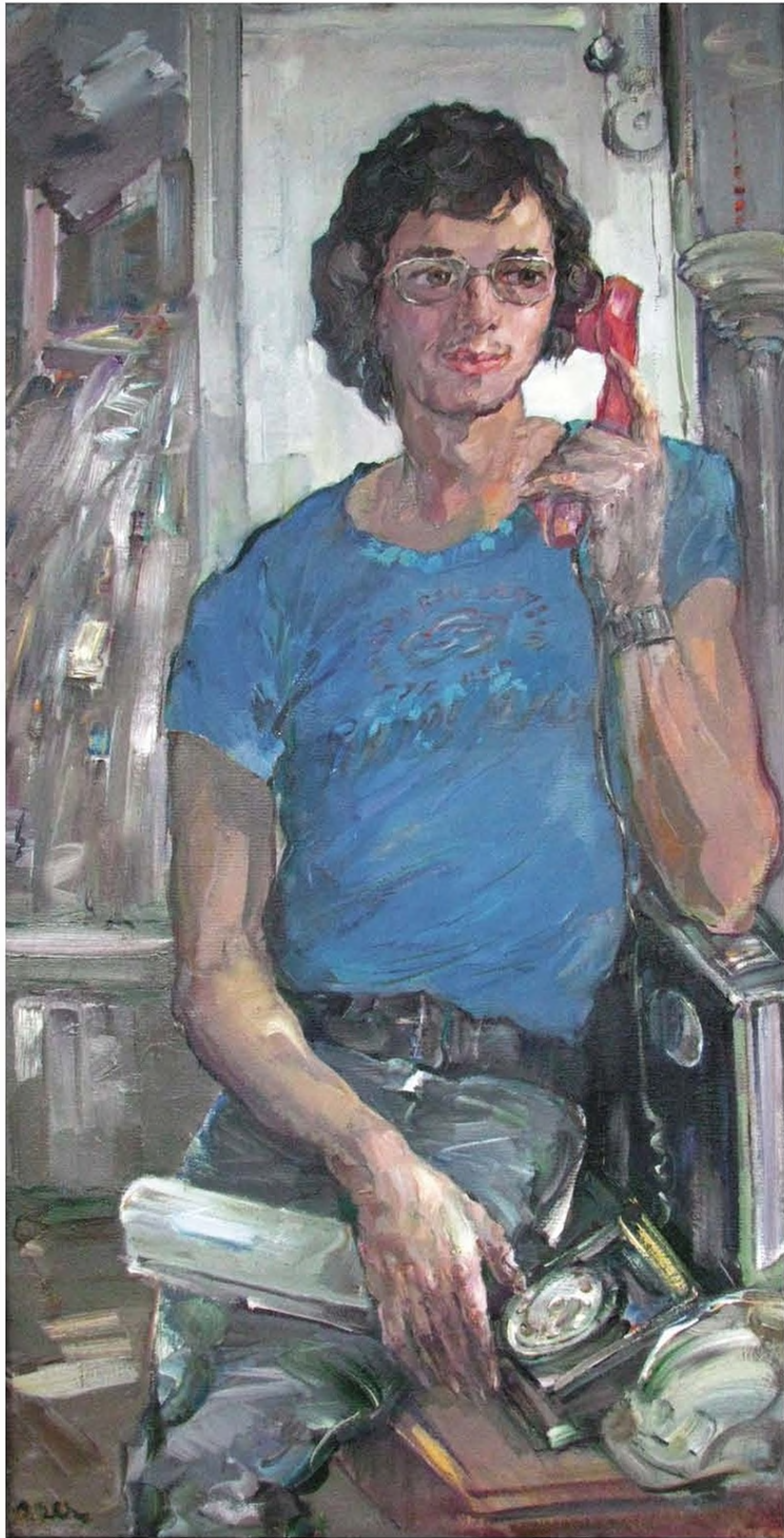
А.С. Чеснокова. Портрет внука Славы. 1976. Х., м. 112x55