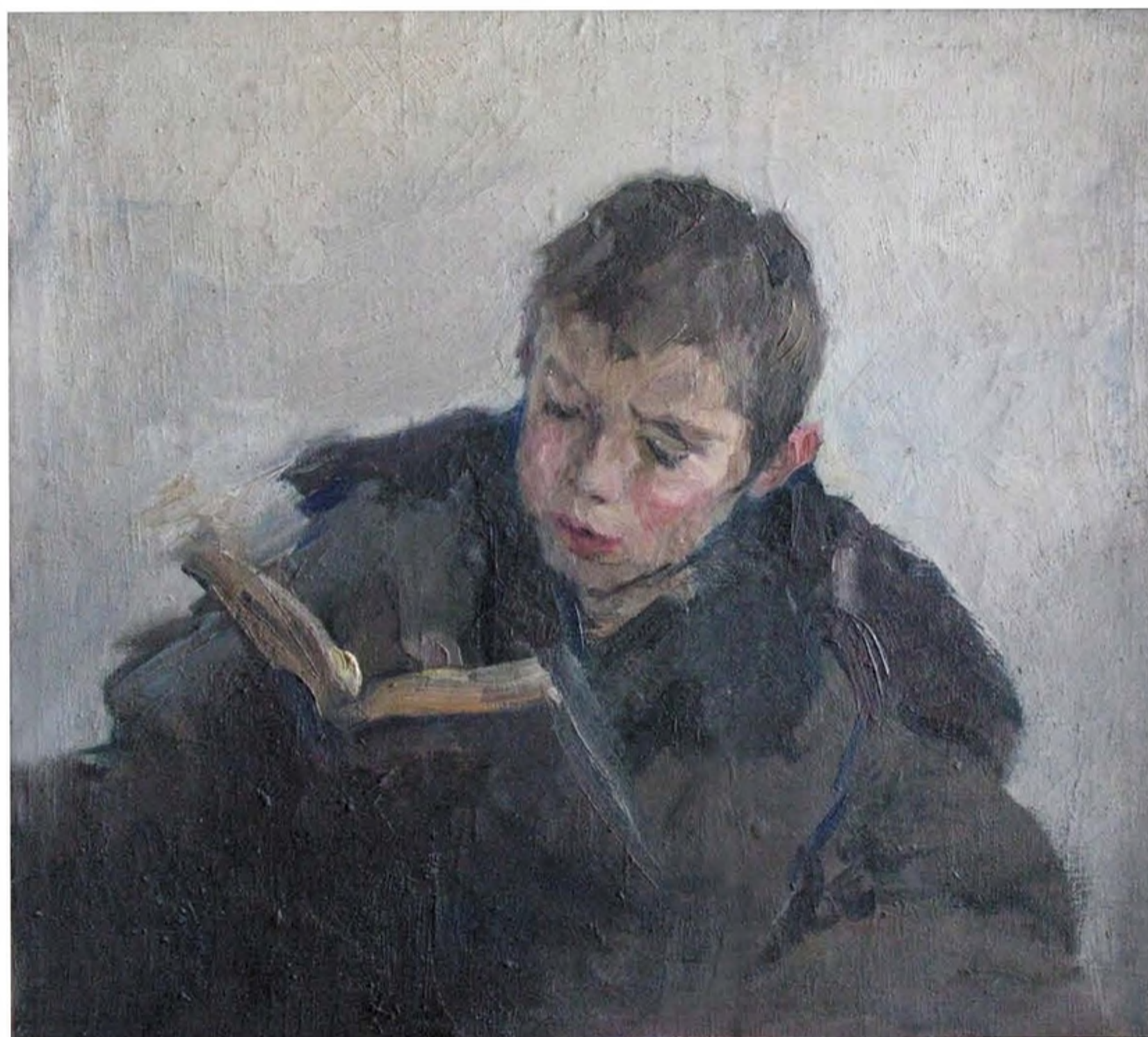
А.С. Чеснокова. Портрет старшего сына. 1945. Х., м. 50x60

Прекрасное чувство цвета позволяет художнице в скупой гамме красок передать свое видение послевоенного города: вереницы каменных зданий за Невой, буксиры – и снова вода Невы.