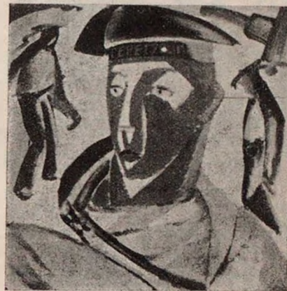
В. Татлинъ. Матросъ...