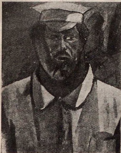
Бурлюкъ. Портретъ студента...

Въ сѣрыхъ будняхъ скучной петербургской жизни, жизнерадостный, задорный смѣхъ — такая рѣдкость!