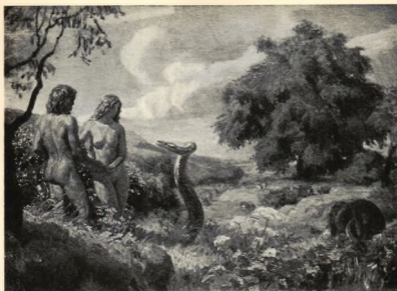
»ORMEN SADE TILL KVINNAN.» OLJEMÅLNING AF JOAKIM SKOVGAARD.

dessa 100 kvinnor fanns det också några karaktiga. Och konst är, tror jag, det enda område, där kvinnan intresserar mera, ju mera karaktig hon är. Det hade varit bättre om dessa fått rymligare plats, ty om den Nietzscheska satsen, att ett folk är den omväg naturen tar för att frambringa en stor man, är något för odemokratisk, så torde det dock ej kunna nekas, att de djupa leden, när fråga är om konstnärsgupper, böra vara så trångbudda som möjligt och helst afskiljas från de rymliga celler, där konstdrottningar, liksom bidrottningar, på det frikostigaste sätt böra få sin utrymmesfråga löst.