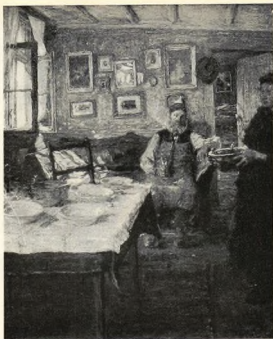
MIDDAGSMAT. OILJEMÅLNING AF GOTTHARD KUEHL.

tet dyrbart, som kallas »Eline skal ud», en färglagd teckning, där hvarje streck talar om hemmets styrkande, kärleksfulla ande. Också är Skovgaard en af de ytterst få äkta religiösa målare som funnits på de sista 200 åren. Redan det förefaller mig tala godt för dansk konst. Äkta naivitet och äkta religion ge, då de omsättas i äkta konst, just den största konsten. Skovgaards målningar i domkyrkan i Viborg äro fyllde af stilkänsla, djupt allvar och strålande skönhet. Hans målning här på utställningen, »Slangen sagde til Kvinden», när trots sina förtjänster ej upp till hans härliga bild af samma ämne på vårt Nationalmuseum, där landskapet, solbelyst men med blå ovädersskyar, ångar i den tryckande värmen af starka dofter och den syndiga