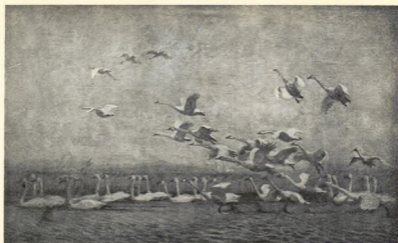
SVANARNA LÄTTA. OLJEMÅLNING AF JOHANNES LARSEN.

ligen framkalla också många nya hus en viss husleda, och en monumental leda blir ej sällan följden af mången ny väggmålning.