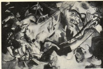
KOMPOSITION 6. OLJEMÅLNING AF WASILY KANDINSKY

poetisk ruin? Ligger det ej något af förgångelsens hemiska storhet öfver den halft förtärda jättefrukten?