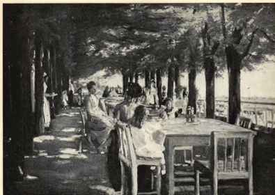
TERRASSEN PÅ JARODSRESTAURANTEN. OLJEMÅLNING AF MAX LIEBERMANN. Tillhör Kunsthalle i Hamburg.

apa sig, sinnet för det äkta, allt detta kan vara nyttigt att ha, också i konsten. Liksom i 1600-talets Holland står den stora allmänheten i Danmark i förhållande till konsten. Målarna ägsätta ej sina tafflor fiktiva värden, och äfven enkla människor köpa konst. Somliga känna igen sig på de interiörer, där något af det lugn finnes, som behöfves för att de finaste andliga blommorna skola slå rot och trivas.