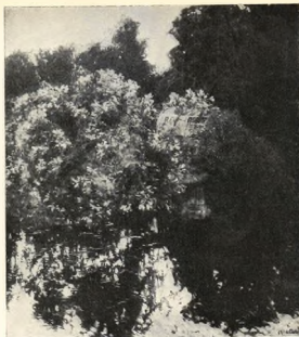
BLOMMANDE HÄGG. OLJEMÅLNING AF OLOF ARBORELIJUS. Inköpt af Nationalmuseum.

nom några decennier, om man också ser att allt ej är lika bra ens hos mästaren?