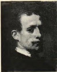
SJÄLFPORTRÄTT. OLJEMÅLNING AF HANS VON MARÉES.

Tillhör Histor. Sammlung des Münchens Künstler-Genossenschaft.