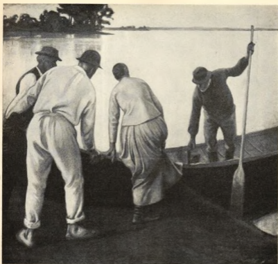
ARBETSFOLK PÅ HEMFÄRD. OIJEMÅLNING AF PEKKA HALONEN. Tillhör doktor Hedman.

har jag så pass länge pröfvat mina känslor, att jag kan komma med en manligt och fast: Ja