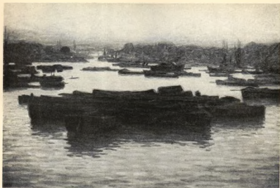
PRÅMAR. OJFEMÅLNING AF H. K. II. PRINS EUGEN. 1914.

mera charmfyllda än deras egna taflor. Låt vara att liksom Bismarck misslyckades i att öfvervinna socialisternas trotsiga trumpenhet, så strandade den kraftige och välvillige generalkommissariens försök att få med några af de konstnärer han allra helst ville ha till Malmö, och skulle man ej kunna tänka sig att den helige Antonius någon gång lät sin dygd hvila sig? Säkert är, att vid ett par tillfällen generalkommissarien varit aldeles för älskvärd.