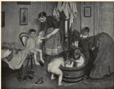
BARNTVÄTTNING. OLIEMÅLNING AF VIGGO JOHANSEN.