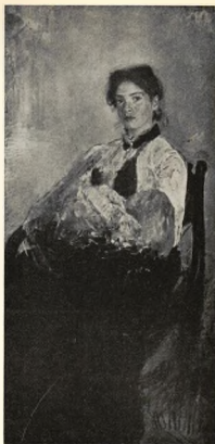
PORTRÄTT AF FRU VON DERVISE MED SITT BARN. OLJEMÅLNING AF V. A. SEROFF.

GALLÉN hade haft den för en konstnär sällsynta klokheden att ge ett retrospektivt urval, tillräckligt för att visa hur stark han är på olika områden. Hur vacker både som tanke och konstverk är ej »Den första undervisningen», målad 1887. Den lilla näpna flicknacken böjdes