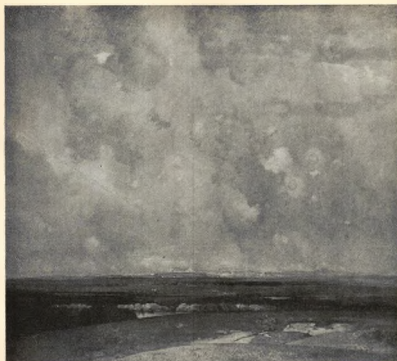
LANDSKAP. OLJEMÅLNING AF TONI STADLER. Tillhör Bayerska staten.

diskret lyscr. Den har nu inköpts af Nationalmuseum för lotteripengarna.