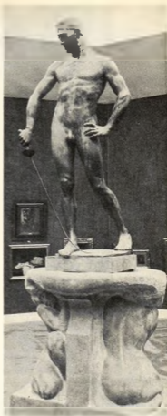
FÄKTARE. STATY I BRONS AF HUGO LEDERER.

Man har tagit med till och med en taffa af den 1880 afidne FEUERBACH, och härigenom ompänner utställningen omkring fyrtio år, ehuru det allra mesta är tillkommet efter år 1900. Det enhetliga och på en visserligen kort men i stället fast tradition byggande, som utmärker dansk konst, finnes ej i den tyska Men omväxling saknas icke, och den sista anmärkningen man kan göra mot den tyska konsten är nationell afstängdhet. Tysklands i min tanke främsta moderna kostnärer, Menzel och Leibl, ha öst mycket ur franska brunnar, om också den senare väl närmast hör ihop med Holbein. Antikens ämnessfär har i hundratal olika former behandlats sedan den antika konstens död. Då det gäller det sista uttrycket är väl Gustave Moreau med sina tafflor fyllda af hellenistisk världssmärta, en fortsättning på linjen Ingres—Chassériau, den mest förfinade. Trots den stiliserade formen äro Burne Jones' Hellasbilder för veklga och söta, Böcklin och Stuck, af hvilka särdeles den förste prisats i höga toner af den tyska konstkritiken, ha en blandning af söktaktighet och brutalitet och något af bengalisk eld-kolorit, som gör bägge deras tafflor bra sällan riktigt tillfredsställande, hur fantasiiggande de än må vara. En egendomlig ställning mellan fantasimålning och realism utmärker den 1887 afidne, på senare tiden så högt skattade HANS VON MAREES. Äro hans klassiska ynglingar och jungfrur litet dvalbenta, så visar han i stället i sin färgpåläggning då det gäller soldatbilderna och