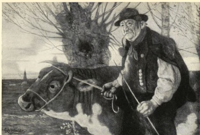
BONDE MED EN KO. OILJEMÅLNING AF ADAM OBERLÄNDER. Inköpt af Nationalmuseum.

snarare motsatsen till stilleben, men samma välgörande känsla af ro och sundhet ligger nästan öfver allt hvad denne store hem-målare utfört.