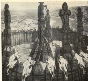
AFGUDARNA. OLJEMÅLNING AF NICOLAS ROERICH.