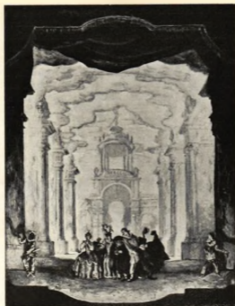
COMÉDIE ITALIENNE. OJLEMÅLNING AF ALEXANDER BENOIS.

sationer? Vi ha länge rörts och tjusats af den djupa mänsklighet och den doft af den ryska jorden, som kom oss till mötes från de stora ryska författarna. Trots att smärtsamma politiska förhållanden och mer än ett halft årtusendes strider ha fjärrat oss från Ryssland, så fatta många hurusom i detta jätteland, motsatsernas land, kuutpiskans land, vänlighetens land både bland de högaste och de lägste, där den renaste evangeliska fromhet lefver bredvid en sjuklig smak för det perversa, det skulle finnas rika skördar, både materiella och andliga, somliga redan härgade, men också att det fanns väldiga jordlager både på marken och i sinnens, som ännu vänta på sädd.