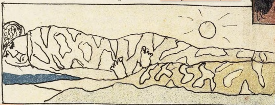
Корвин, К. «Панно для сибирскаго павильона на Парижской выставкѣ».

Изображена наша промышленность и ея чудная дѣятельность.