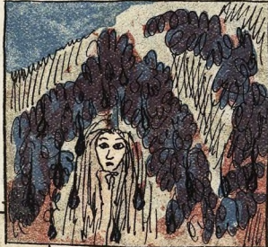
38. «Сирень». Какъ опасно стоять во время дождя подъ сиренью, которую художникъ раскрасилъ слишкомъ усердно! Врубель, М.