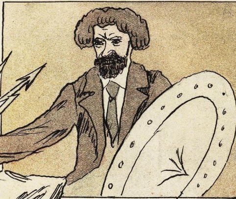
95. Малавинъ. «Портретъ И. Е. Рѣпина».

«Ахъ, вы, съ позволенія сказать, декаденты! Что вы со мной сдѣлали! Ну, маэчи дерево, маэчи бабу, — но зачѣмъ же профессоровъ живописи мазать?! (въ ужасномъ гнѣвѣ потрясаетъ перунами; декаденты — художники въ страхѣ заботятся въ каминъ работы Голубкиной).