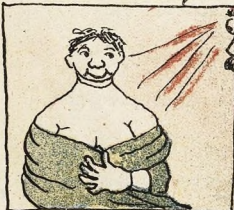
208. «Этюдъ» кухарки Агабы подъ глужими взорами ея кума пожарнаго.

25. «Портретъ» 800 (?) руб. Господину не понравился такой портретъ и онъ отказался заплатить; тогда художникъ изъ мести повѣсилъ портретъ на выставкѣ: «пусть, дескать, публика смѣется» и, для важности, прислалъ нѣсколько вулей справа къ цифрѣ стоимости картины.