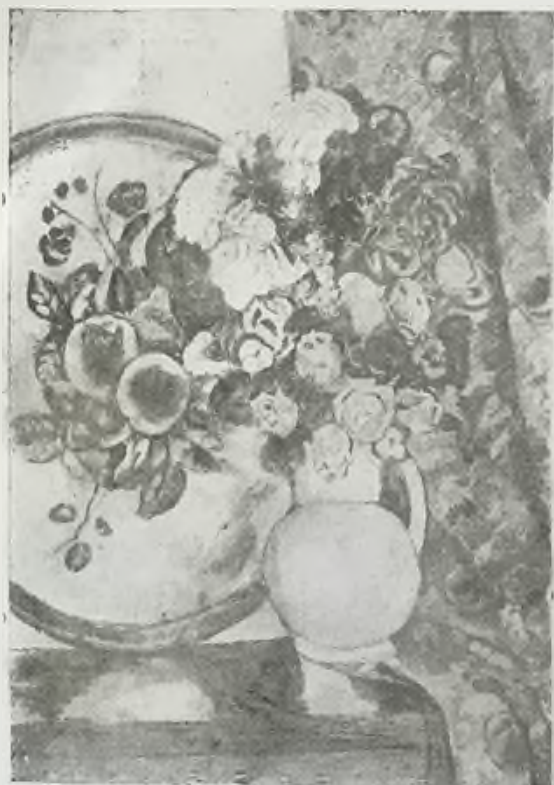
Машков, И. И.