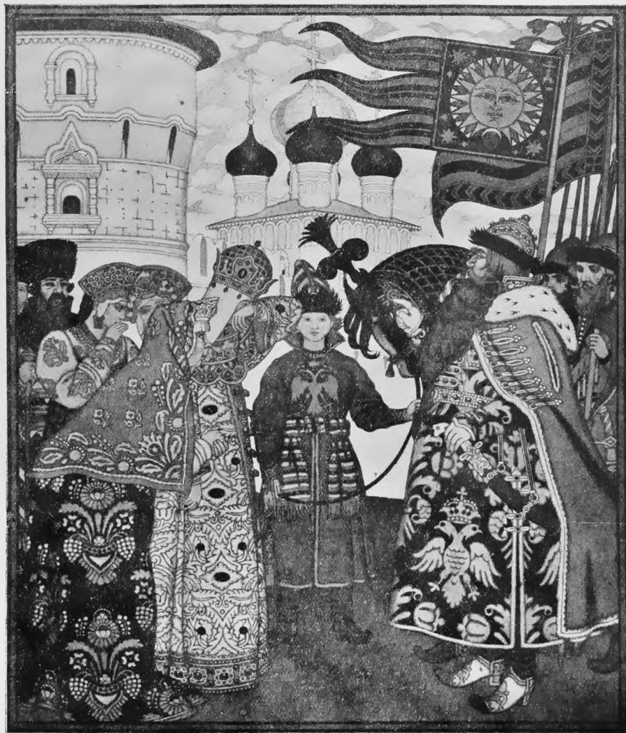
И. Билибинъ: Сказка о царѣ Салтаиѣ.