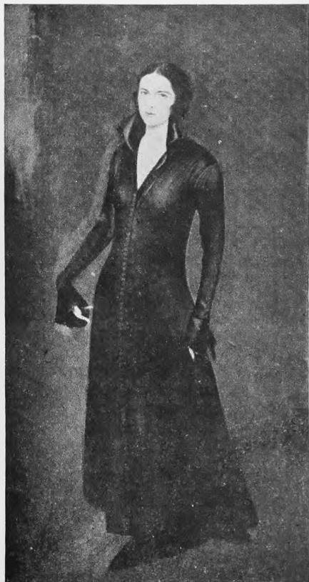
А. Яковлевъ: Портретъ.

рисунками Е. Лансере, съ гравюрами на деревѣ А. Остроумовой, съ «Екатерингофскимъ дворцомъ» А. Н. Бенуа, съ «Новой Голландіей» О. Бразя). Теперь въ Парижѣ на выставкѣ «Міра Искусства» зтотъ культъ стараго Петербурга представленъ гравюрами все той-же А. Остроумовой и графикой М. Добужинскаго.