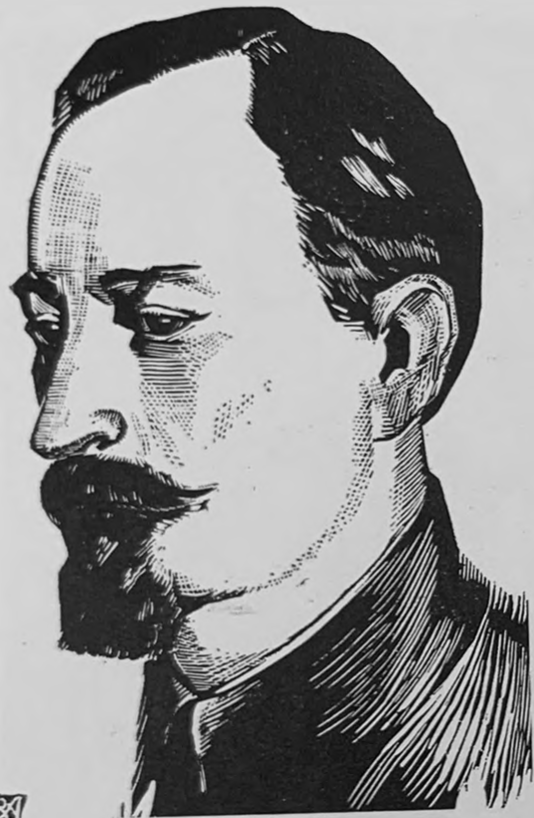
Ф. Э. Дзержинский