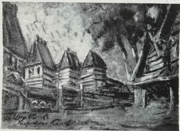
Эскиз декорации к опере А. П. Бородина «Князь Игорь», 1909 г.