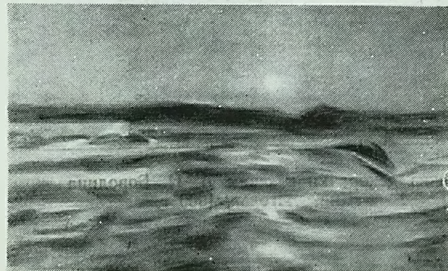
Ледовитый океан. Мурманск. 1890-е гг.