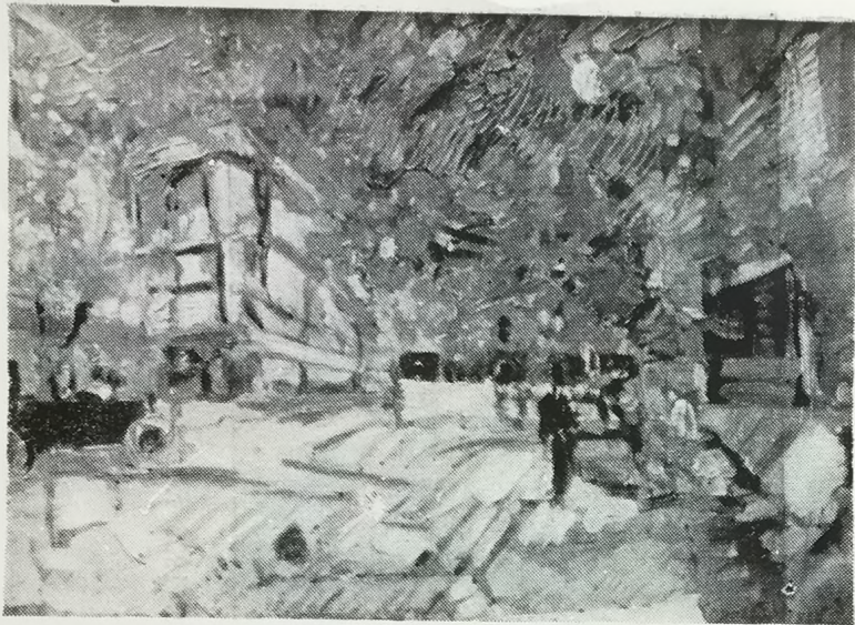
Первый снег в Париже. 1915 г.