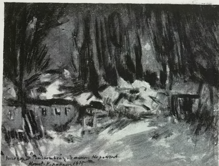
Эскиз декорации к опере Н. А. Римского-Корсакова «Ночь перед Рождеством». 1915 г.

из драгоценнейших находок, заключающихся в точнейших и тончайших красочных соотношениях, характеризующих живое. Они-то, эти находки, и есть то самое зерно, благодаря которому зритель, как музыку, воспринимает поэзию зимы, прелесть свежего снега или тайну крымской ночи, с ароматом красных роз, освещенных колеблющимся теплым светом свечей...»