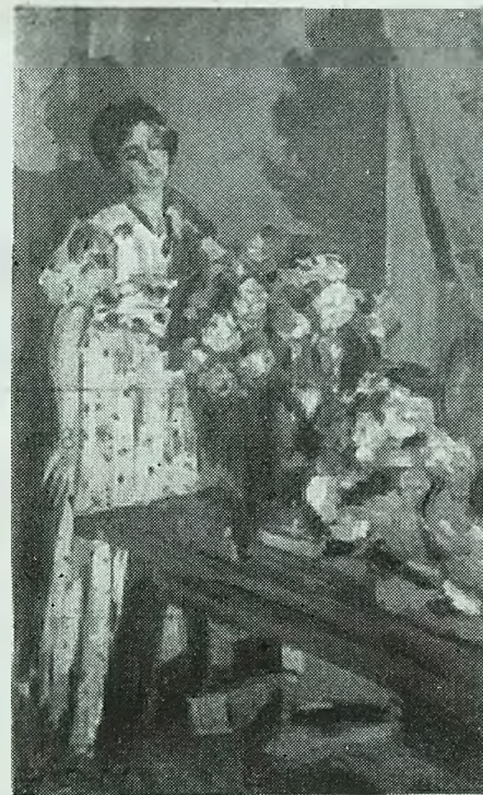
У окна. 1917 г.

«Природа наделила его исключительным глазом колориста», — пишет о Коровине его ученик народный художник СССР Б. В. Иогансон, «...Что бы он ни писал: жаркое солнце юга или серенький денек нашей русской природы — везде, во всем его живопись соткана, если можно так выразиться,