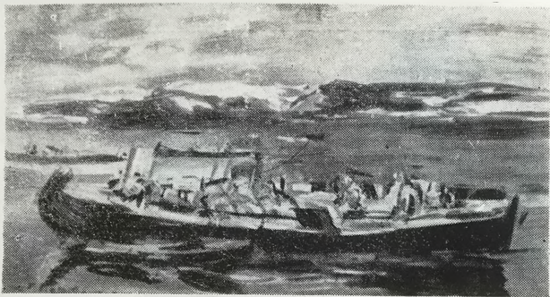
Полночное солнце. Мурманский берег. 1890-е гг.