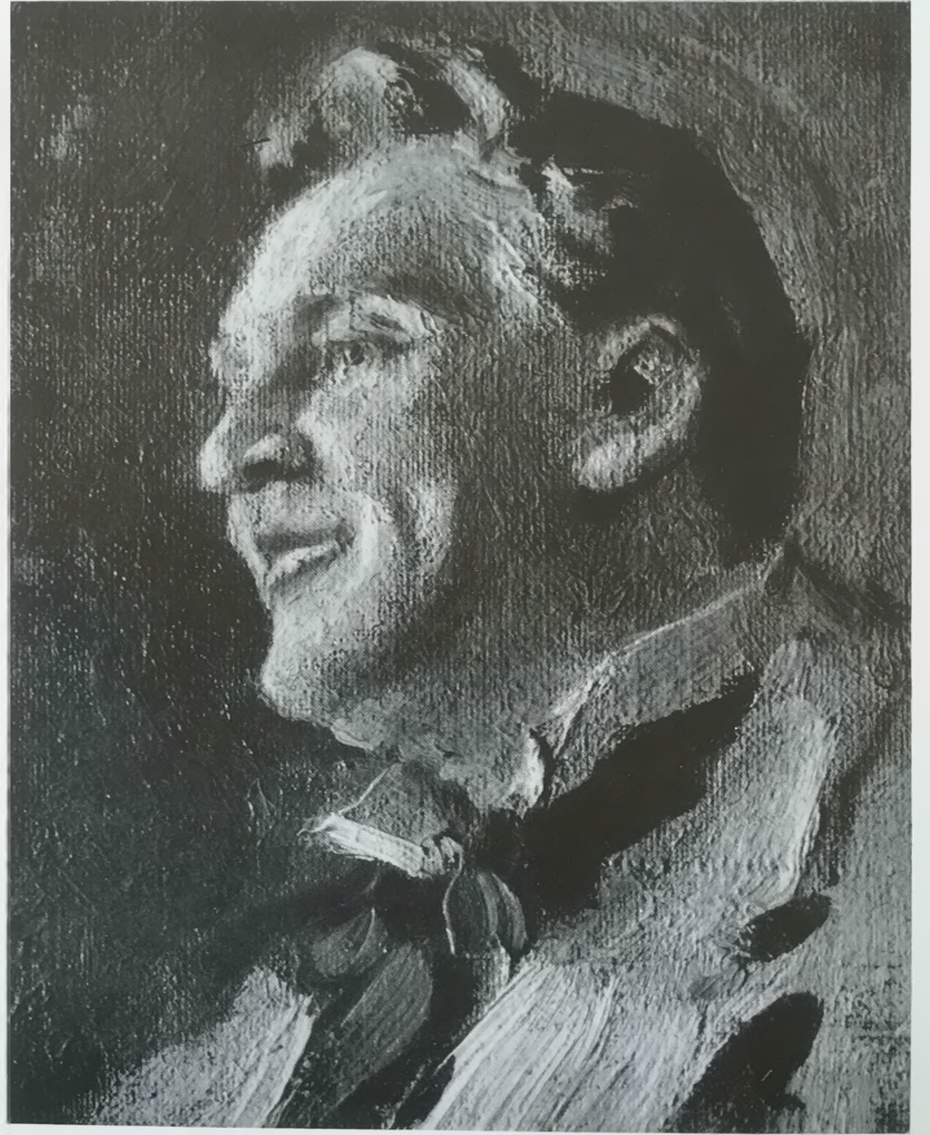
К. А. Коровин. Портрет Шаляпина. 1911