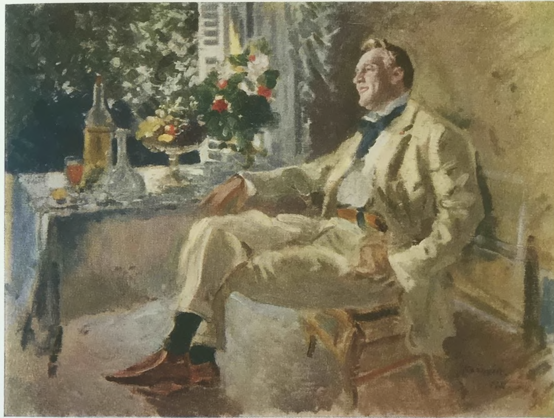
К. А. Коровин. Портрет Шаляпина. Фрагмент

Портрет Шаляпина был создан вслед за совместной работой художника и певца над оперой «Демон», поставленной в Москве в 1904 г.