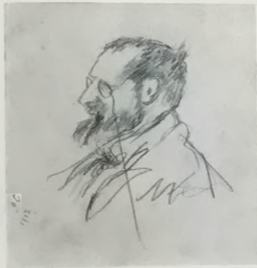
Ф. Шаляпин и К. Портрет К. А. Коровина. Рисунок. 1912

Этот лучший из портретов Шаляпина кисти Коровина был создан за год до самой совершенной из их совместных театральных работ — постановки оперы Мусоргского «Хованщина». Шаляпин выступал не только как исполнитель партии Досифея, но и как режиссер. Коровин, который руководил оформлением