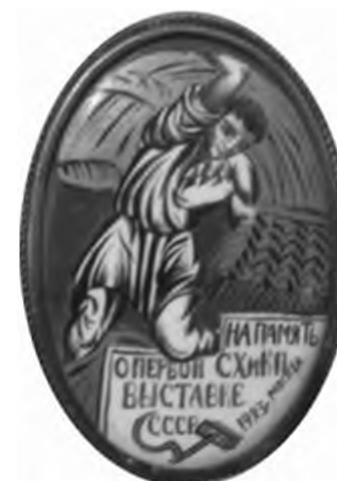
Ил. 5. Значок «На память о первой сельскохозяйственной и кустарно-промышленной выставке СССР». 1923 г.