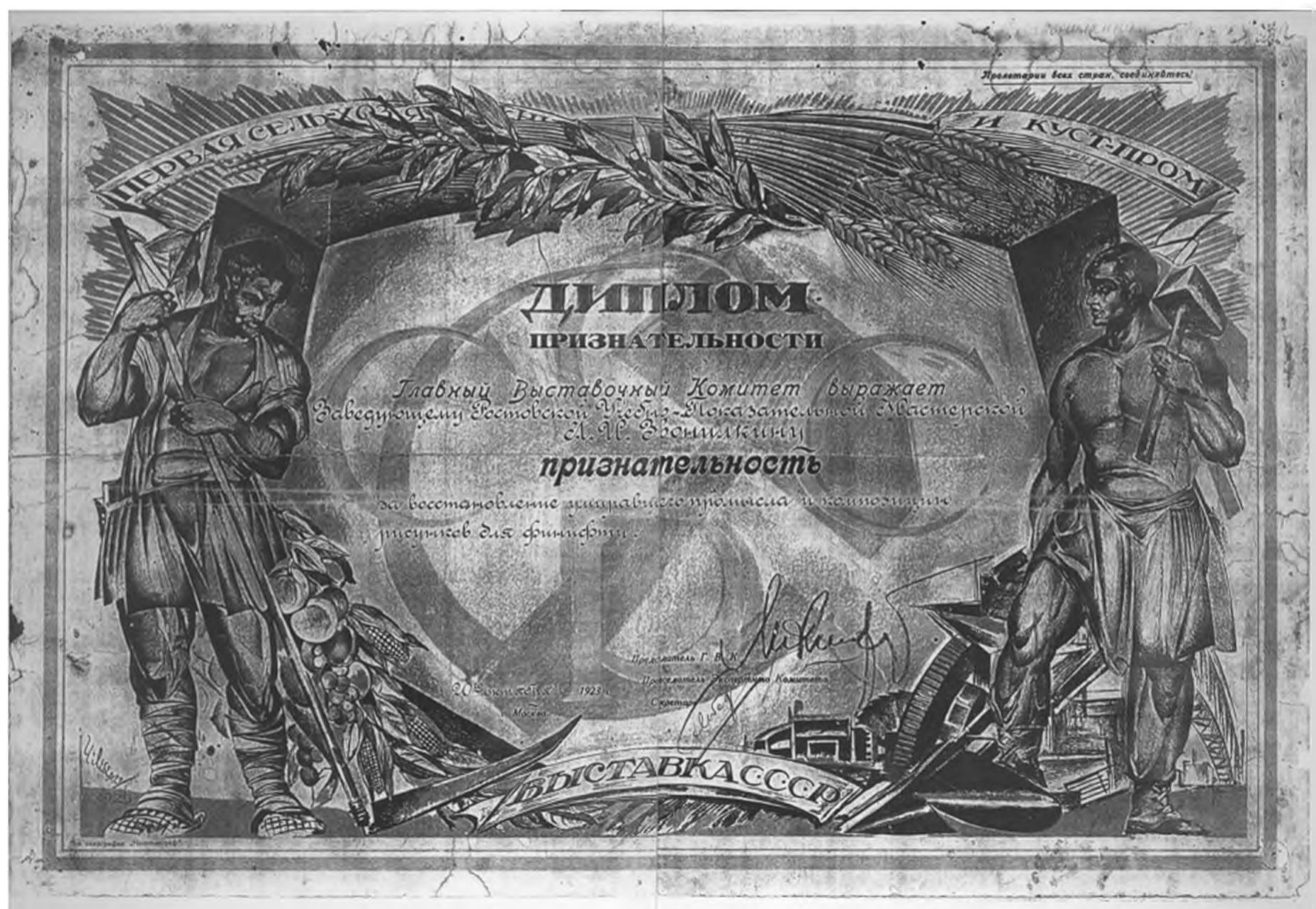
Ил. 4. Диплом. 1923 г. (публикуется впервые)