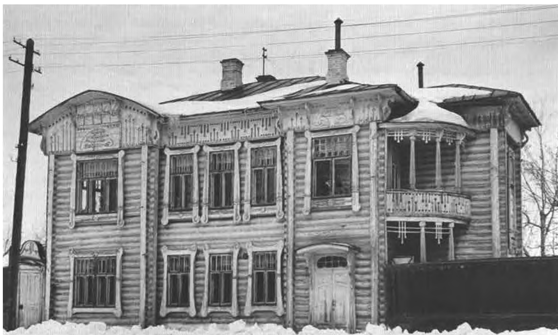
Ил. 3. Дом № 51 на ул. Окружной. Фото сер. XX в.