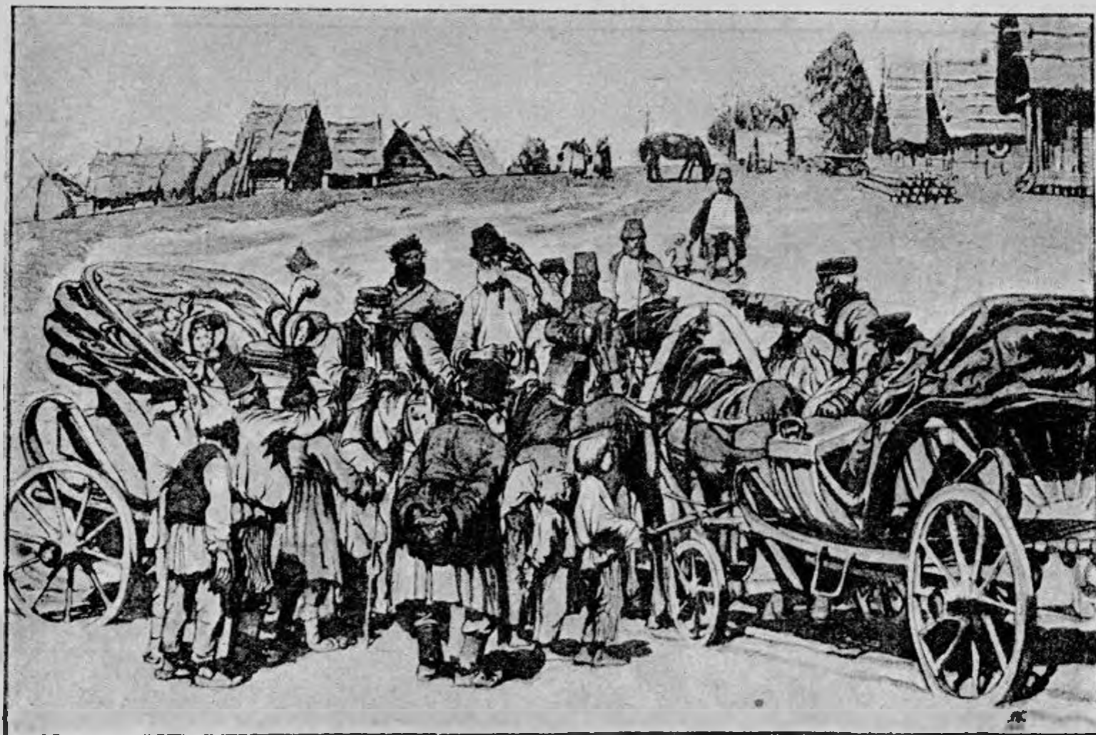
Д. Н. Кардовский.

Кардовскому в этом издании «Горе от ума» принадлежат: а) портрет Грибоедова в гусарском мундире, б) двенадцать цветных и в) 15 черных иллюстраций. Все заглавия и украшения, кроме концовки, принадлежат Нарбуту. Выступая с иллюстрациями к «Горе от ума», Кардовский, несомненно, сознавал всю ответственность задачи, которую он на себя взял. Он хорошо знал, что до него «Горе от ума» отлично иллюстрировал