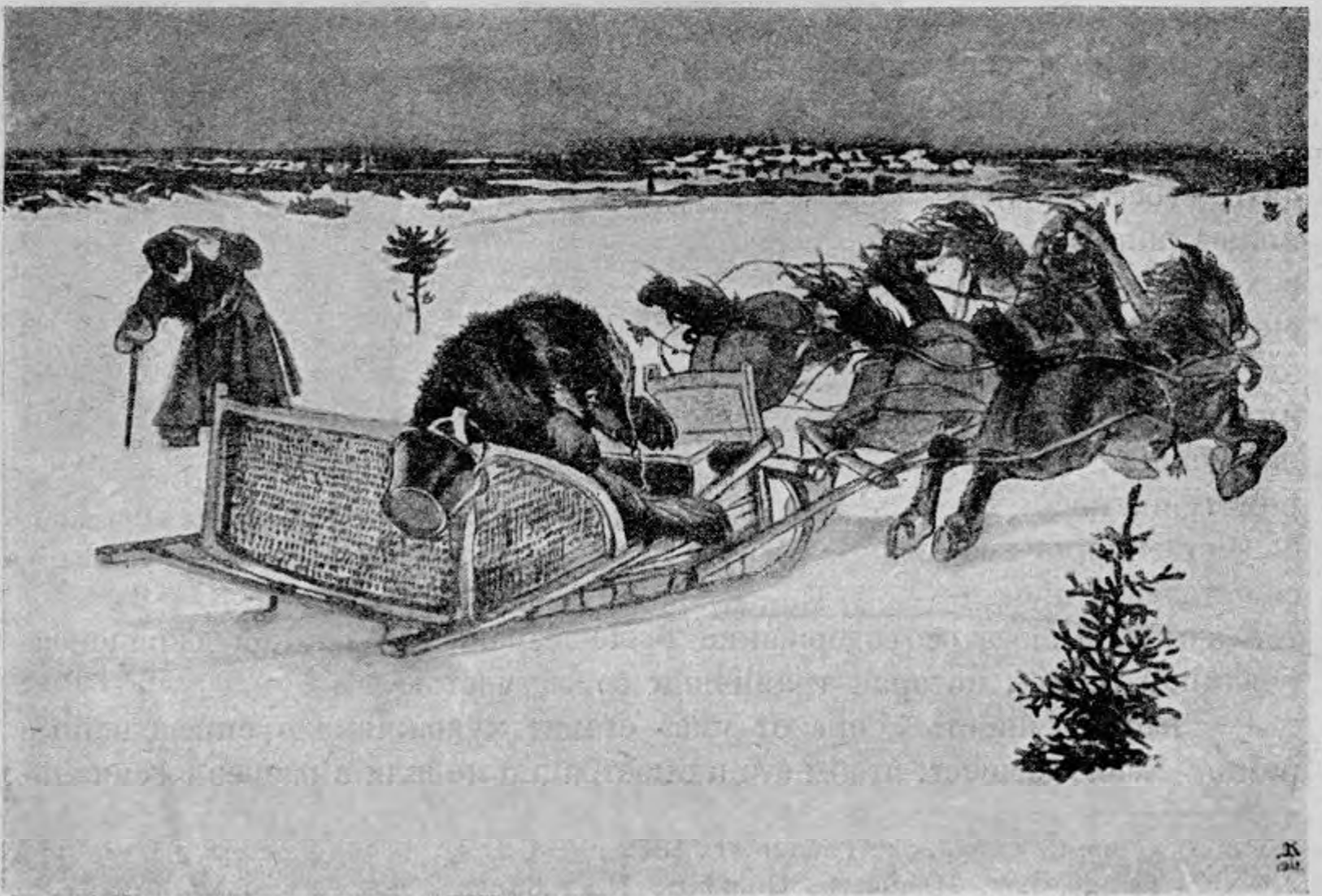
Д. Н. Кардовский.

Совсем другое впечатление производят однотонные, черные рисунки. Общая композиция развернутой книги не нарушается здесь вторжением пестрых красок акварельного рисунка. Глаз видит в однотонной черной иллюстрации то, к чему он привык при чтении текста. Черное и белое, эта основа текста, сохраняется в рисунке, детали которого ступенчато