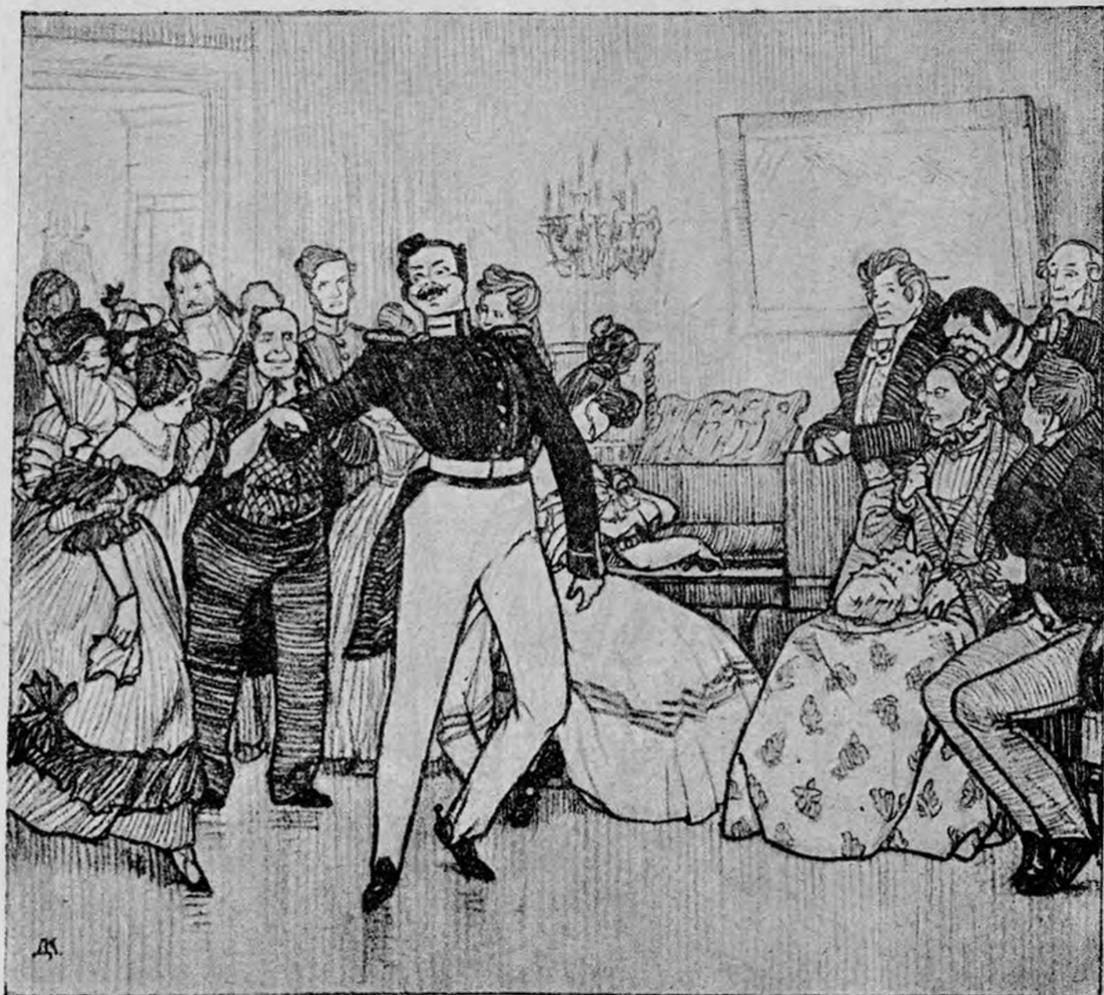
Д. Н. Кардовский.

Известна роль первого из них в истории русской живописи, — как учителя целой плеяды выдающихся русских художников. Достаточно назвать имена хотя бы таких его учеников, как Репин, Врубель и Серов, чтобы оценить роль Чистякова как профессора Академии. Репин в своих воспоминаниях называет его «велемудрым жрецом живописи». Врубель чрезвычайно высоко ценил Чистякова за его философское отношение к искусству и за умение зажечь в учениках любовь «к тайнам искусства самодовлеющего». Однокашник Д. Н. Кардовского по Академии, И. Э. Грабарь, свидетельствует, что у Чистякова «ученик приучался к строгому отношению к натуре и привыкал к мысли, что нет ничего легкого, все одинаково трудно, все одинаково интересно, важно и увлекательно». Чистяков учил, что «рисование не есть только развлечение: оно такая же суровая и, главное, точная наука, как математика. Здесь есть свои незыблемые законы, стройные и прекрасные, которые необходимо изучать».