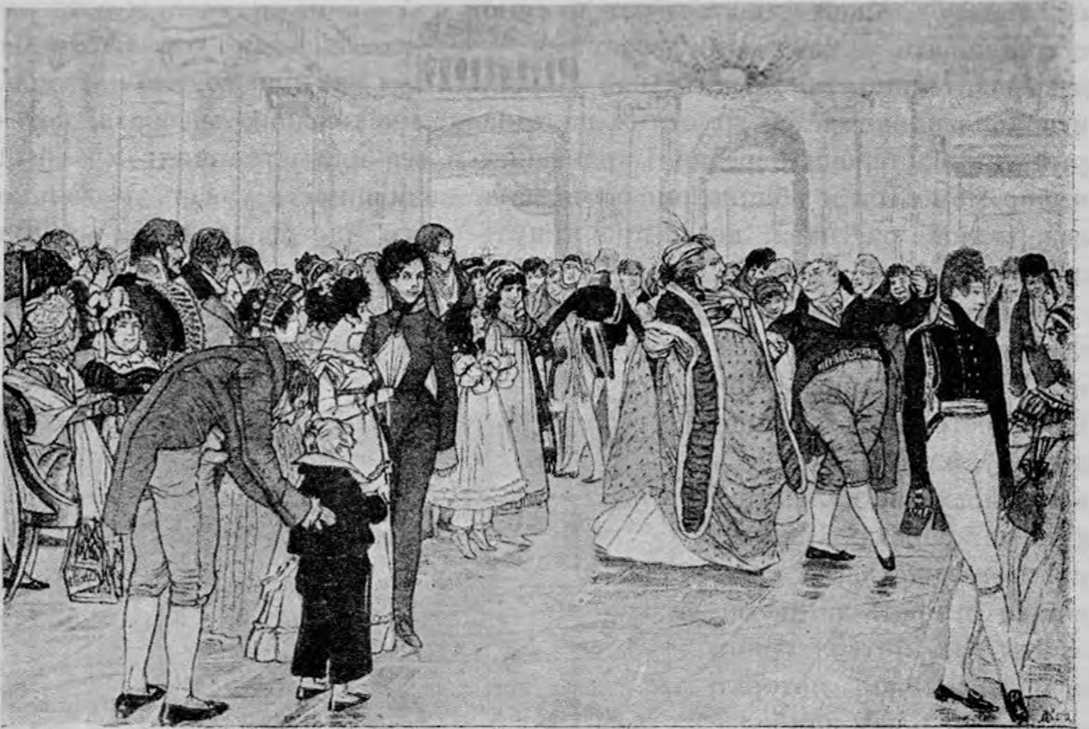
Д. Н. Кардовский.