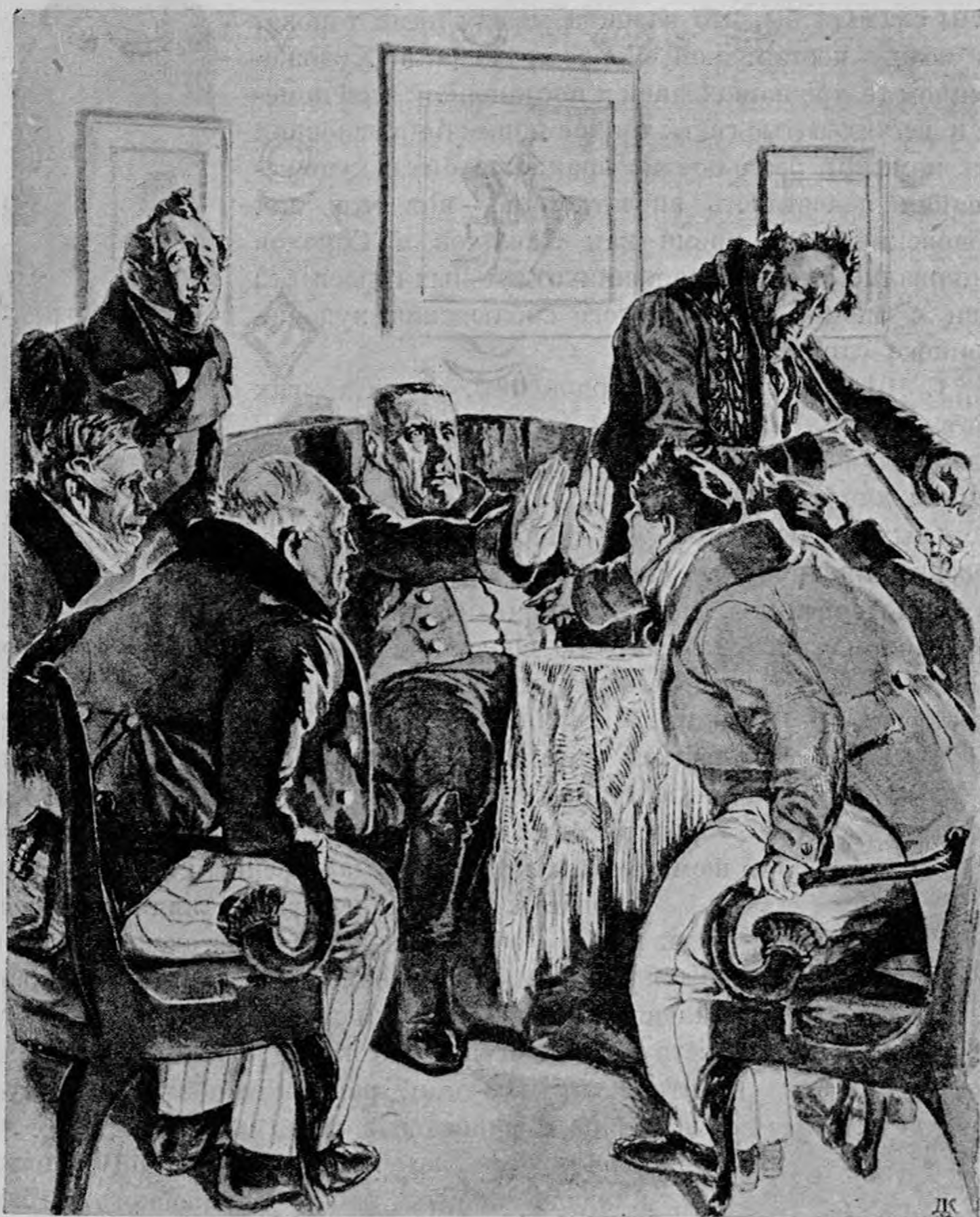
Д. Н. Кардовский.

При сравнении с ранее опубликованными иллюстрациями к «Горе от ума» других художников, рисунки Кардовского не только не проигрывают, но, наоборот, выявляют свои несомненные достоинства. Рисунки