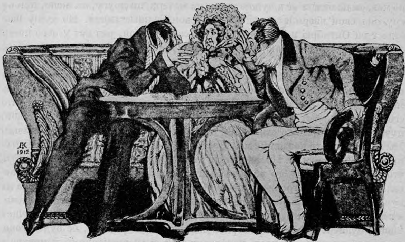
Д. Н. Кардовский.