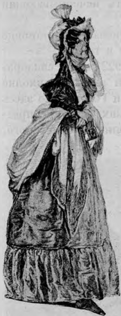
«Ревизор». Жена лекаря.

Деятельность Кардовского в области постановки сцениче-