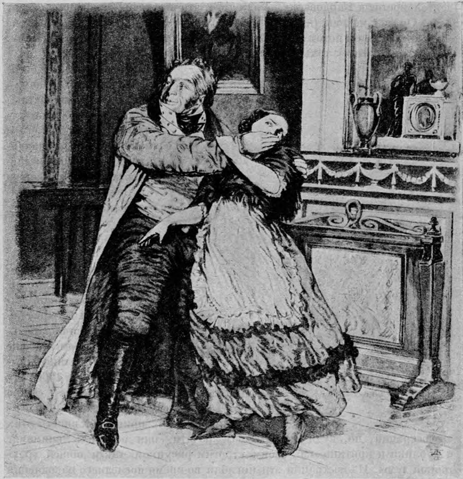
Д. И. Кардовский.

образование многие русские художники. Здесь сформировалось художественное дарование Кардовского, определились его вкусы, и наметился план будущей деятельности. Тут были закончены первые литературные иллюстрации — акварельные рисунки к «Царю Салтану», показанные на выставке «Мира Искусства».