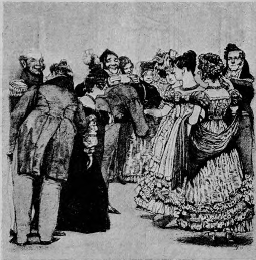
Д. Н. Кардовский.

от Репина быть помощником по преподаванию живописи в его мастерской при Академии. Эта совместная работа с Репиным длилась 4 года, до получения Кардовским звания профессора и собственной мастерской при Академии. Вплоть до 1919 году он отдавал главные свои силы преподавательской деятельности, пропустив через свою мастерскую сотни молодых художников. Несомненно, что дело преподавания мешало творческой деятельности, и Кардовский не дал того, что по своему дарованию он мог дать. Он дал меньше (имеем в виду большие полотна), чем дали другие художники, еще и потому, что он строго относился к себе, как художнику, и выпускал в свет только вполне законченные произведения.