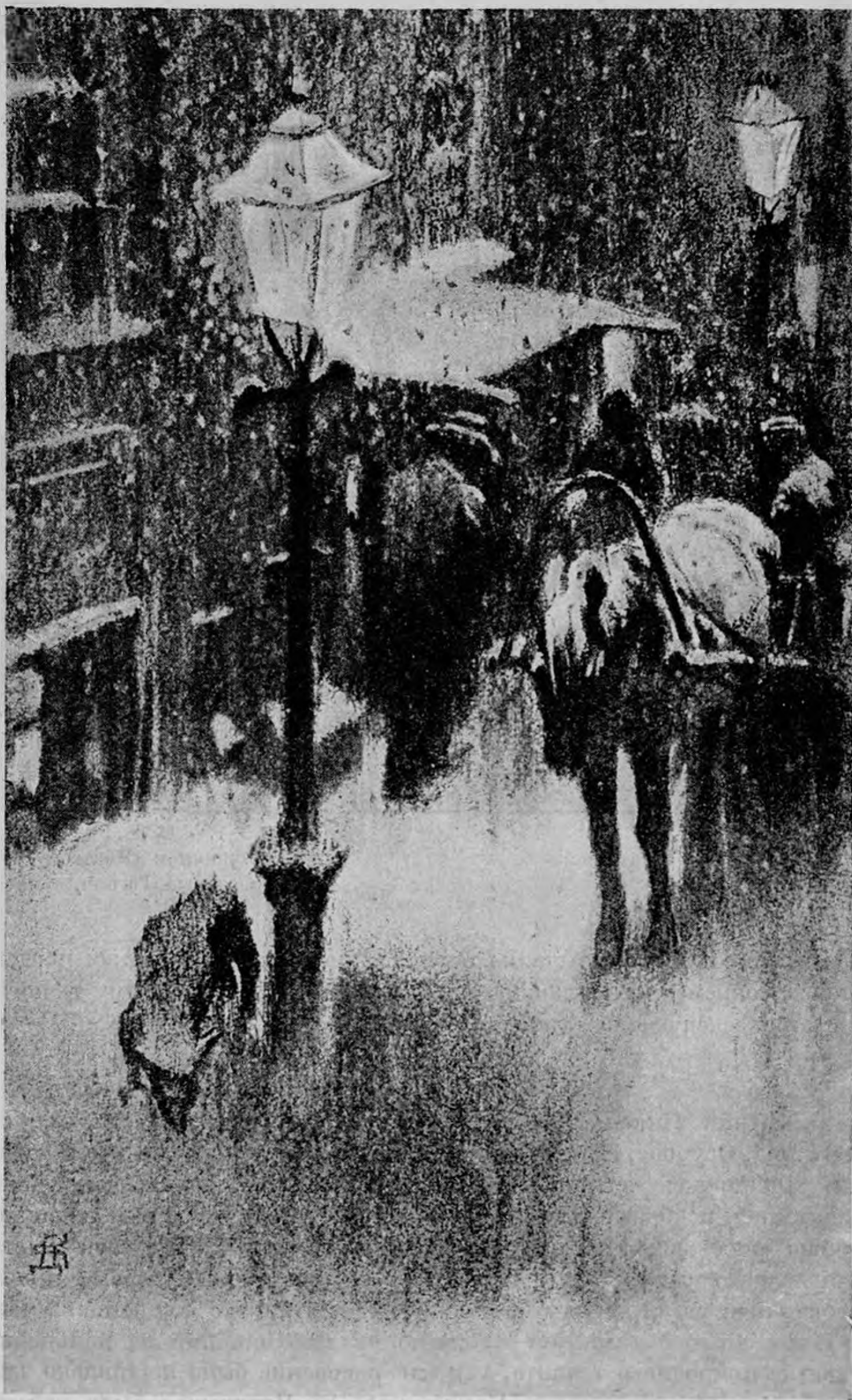
Д. Н. Кардовский. Иллюстрация к «Капитанке» Чехова.