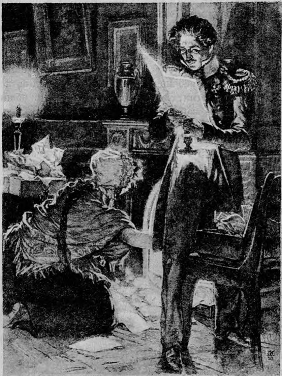
Д. Н. Кардовский.

Иллюстрирование «Горе от ума», несомненно, одна из труднейших задач. Верную и притом художественную картину фамусовского общества мог дать только тот художник, который не только хорошо изучил эпоху по историческим материалам и музейным собраниям материальной культуры, но и тонко почувствовал все детали этого навеки ушедшего быта. Кроме того, художник мог дать убедительную иллюстрацию лишь в том случае, если он сам был очарован этим изумительным литературным произведением, в котором гениальная художественность соединилась с просто-