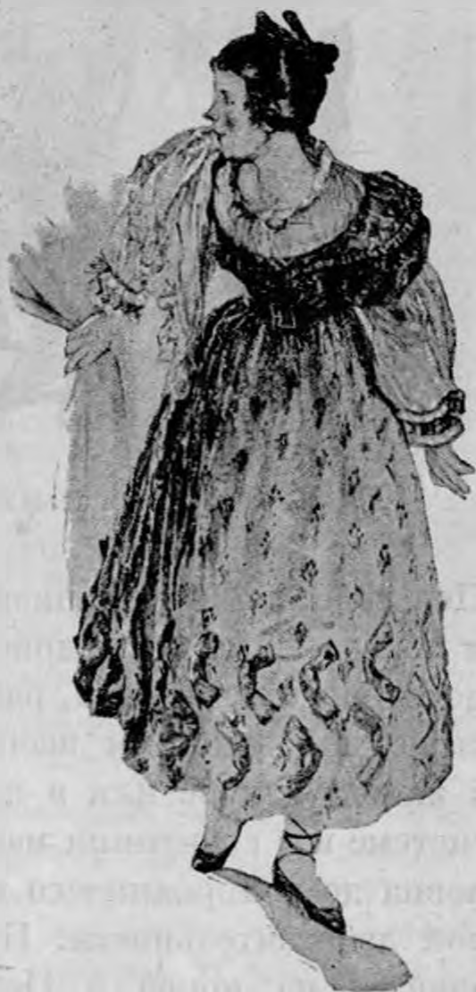
«Ревизор». Марья Антоновна.

Иллюстрации к «Горе от ума» в известной степени тоже подходят под тип зарисовок для сцены, хотя здесь дано гораздо больше, чем это обыкновенно требуется от таких зарисовок. Но такова уж особенность нашего художника. У Кардовского эскизы декораций и рисунки костюмов до того закончены в художественном отношении, что могут с успехом выполнить роль литературных