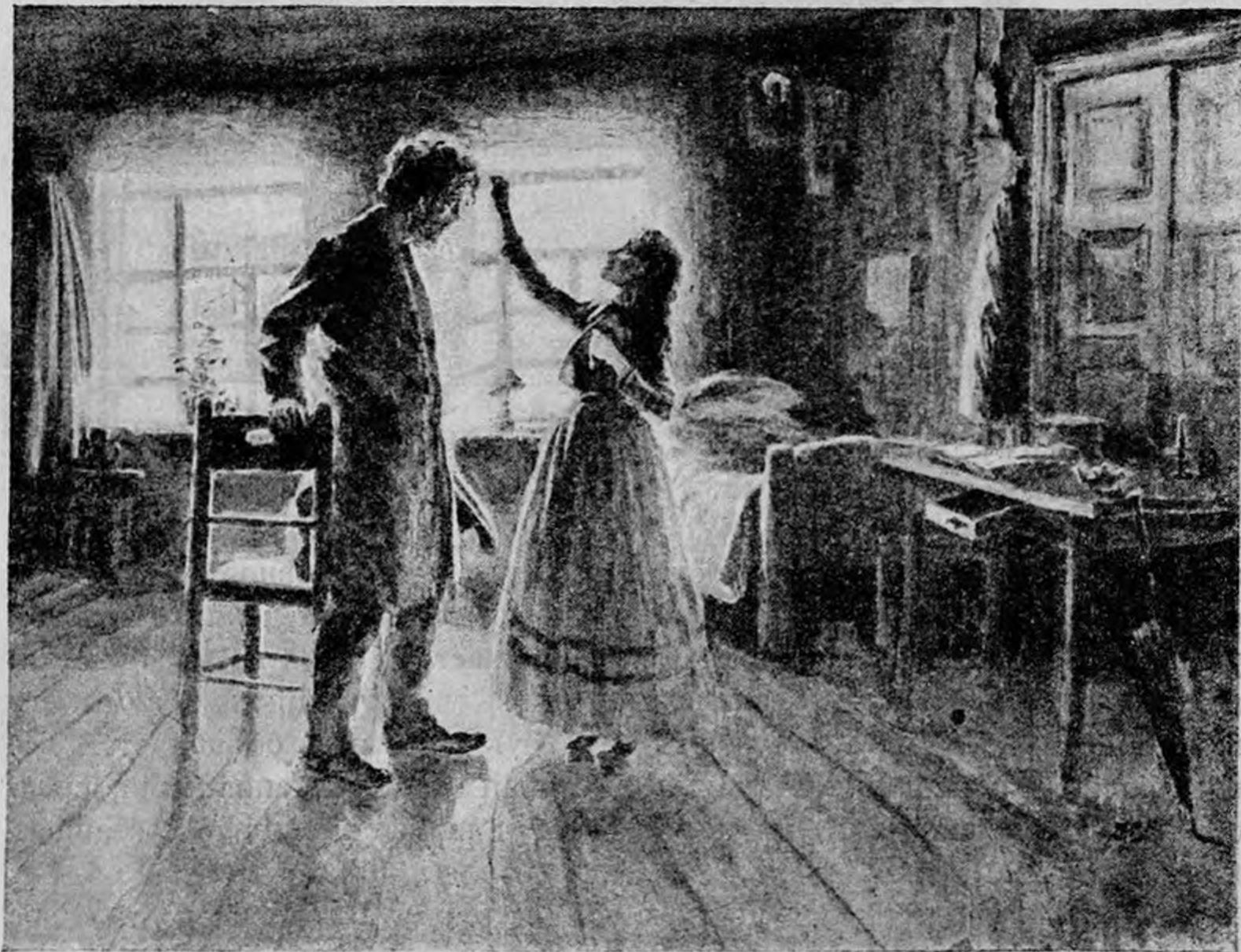
Д. Н. Кардовский.

Другое впечатление получается от однотонных рисунков. Ни один из них не вызывает того досадного чувства нарушения гармонии развернутой книги, которое получается от сопоставления текста и акварельного рисунка. В однотонных рисунках прежде всего обращают внимание фигуры героев комедии, выражение их лиц, их движения; детали обстановки ступшеваются. Интересно отметить, что и сам художник в однотонных рисунках как бы забывает об этих деталях и все внимание сосредоточивает на фигурах. Очевидно, эти детали его интересуют лишь постольку, поскольку они могут быть изображены в ярких красках.