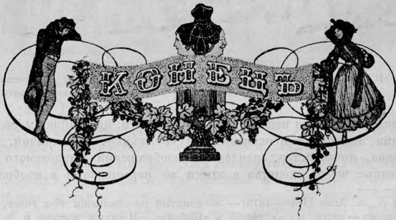
Д. Н. Кардовский.

И это очень жаль, так как Кардовский принадлежит к числу тех немногих русских художников, которые обладают не только талантом живописца и рисовальщика, но и чувством тонкого понимания литературных произведений.