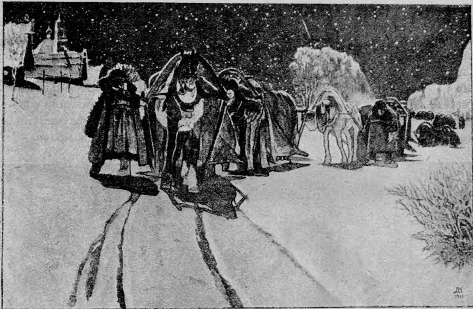
Д. И. Кардовский.