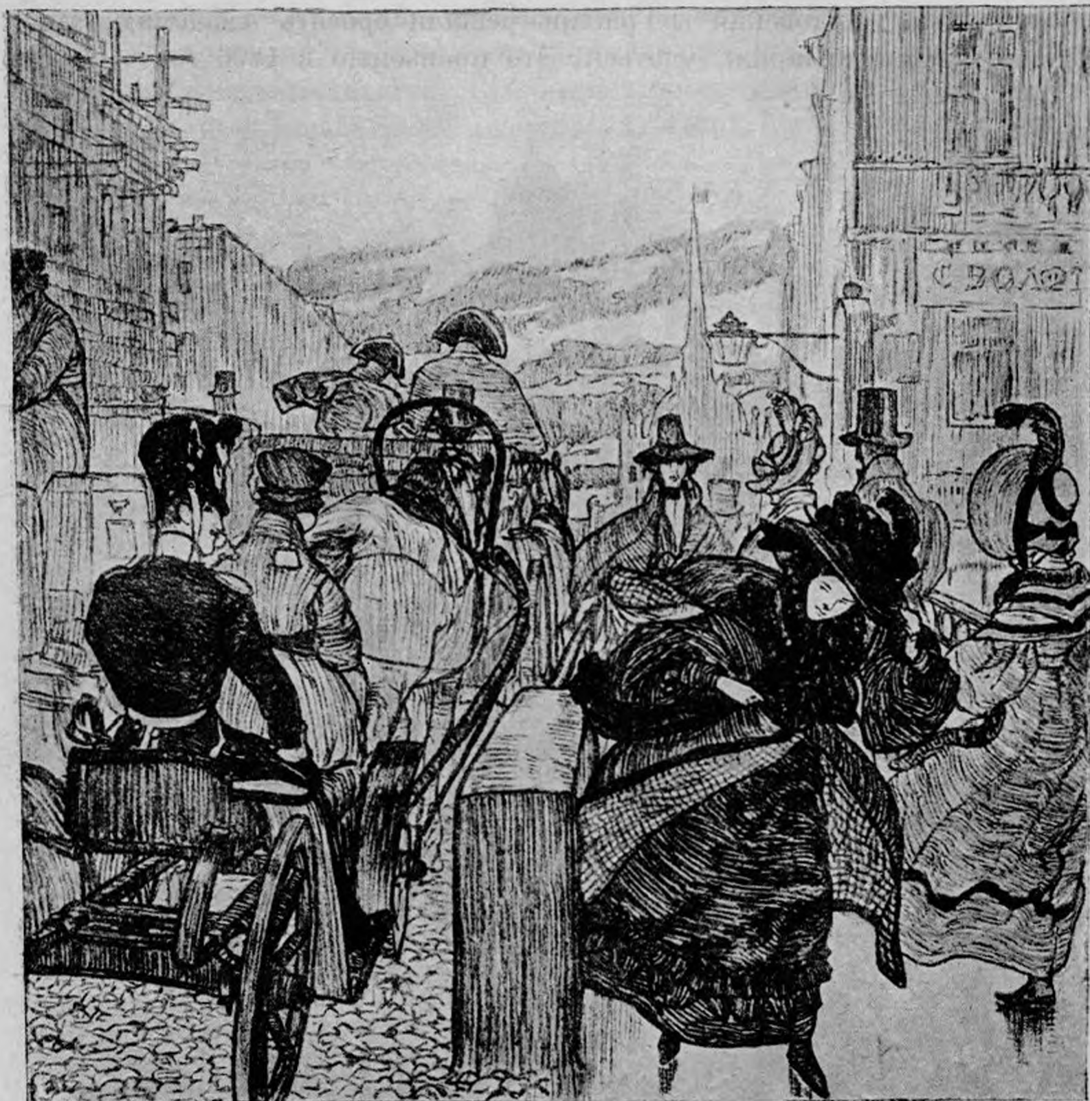
Д. П. Кардовский.