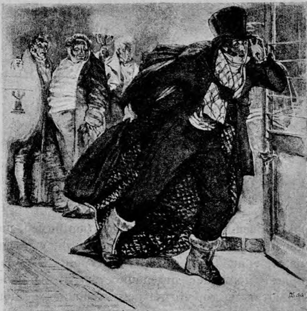
Д. Н. Кардовский.

Эти первые иллюстрации Кардовского как бы задали основной тон всей его дальнейшей работе в области иллюстрирования литературных произведений. Как в иллюстрациях к «Каштанке», так и во всех остальных его иллюстративных работах Кардовский прежде всего стремится выбрать такие моменты в литературном произведении, которые являются в нем наиболее значительными, наиболее для него характерными и, наконец, наиболее исчерпывающими его содержание. Он не боялся трудностей передачи сложных сцен; он вкладывал в них бездну труда; вероятно, много-много раз переделывал каждый рисунок, но в конце концов добивался желательного результата. Каждый рисунок его закончен до последних деталей, но вместе с тем не перегружен излишними подробностями, — он дает ровно столько, сколько нужно для полной иллюстрации текста.