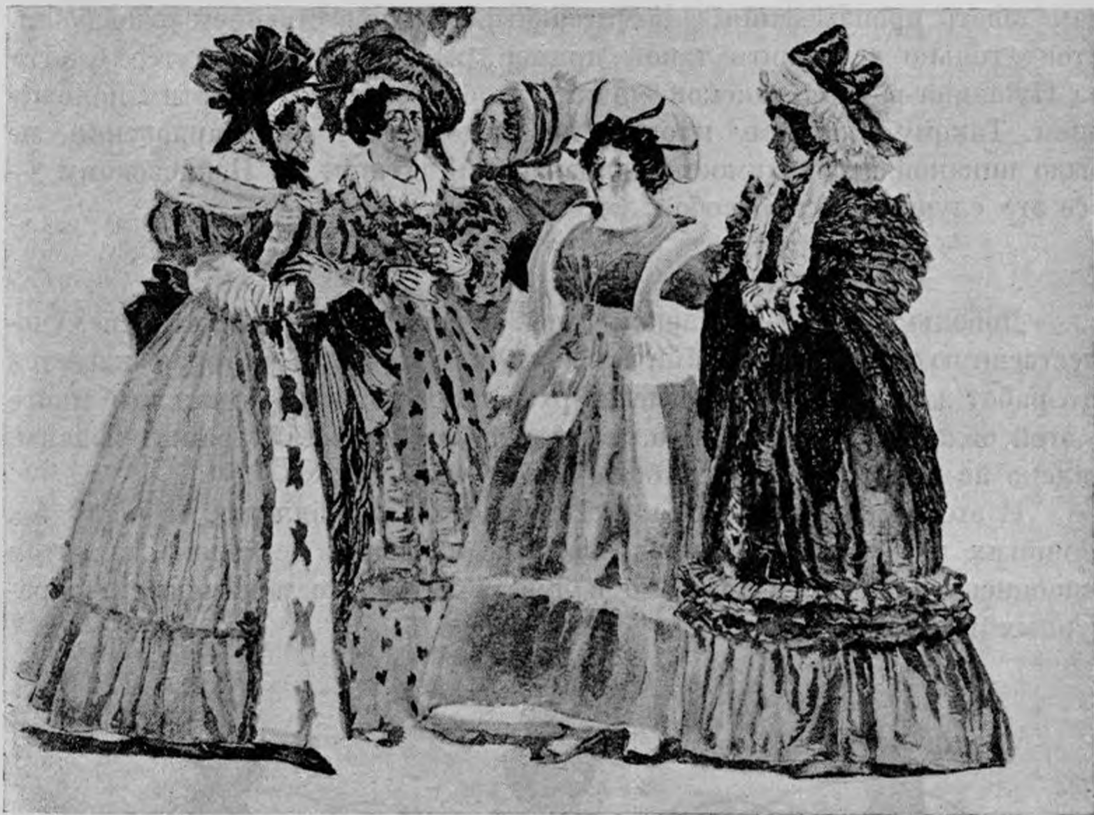
Д. Н. Кардовский.

Однако, несмотря на все старания избежать чужого влияния, Кардовскому в данном случае это не совсем удалось. Дело в том, что наш художник, по собственному его признанию, считает, что лучшими иллюстраторами Гоголя являются Агин и Боклевский 1) . Последний ему особенно нравится, как изобразитель гоголевских типов в портретах. Изображение некоторых персонажей он считает идеальным. Даму приятную во всех отношениях, по его мнению, никто не изобразил так бесподобно, как Боклевский. И вот, увлечение этим художником, по нашему мнению, для Кардовского не прошло бесследно. Невольно, сам того