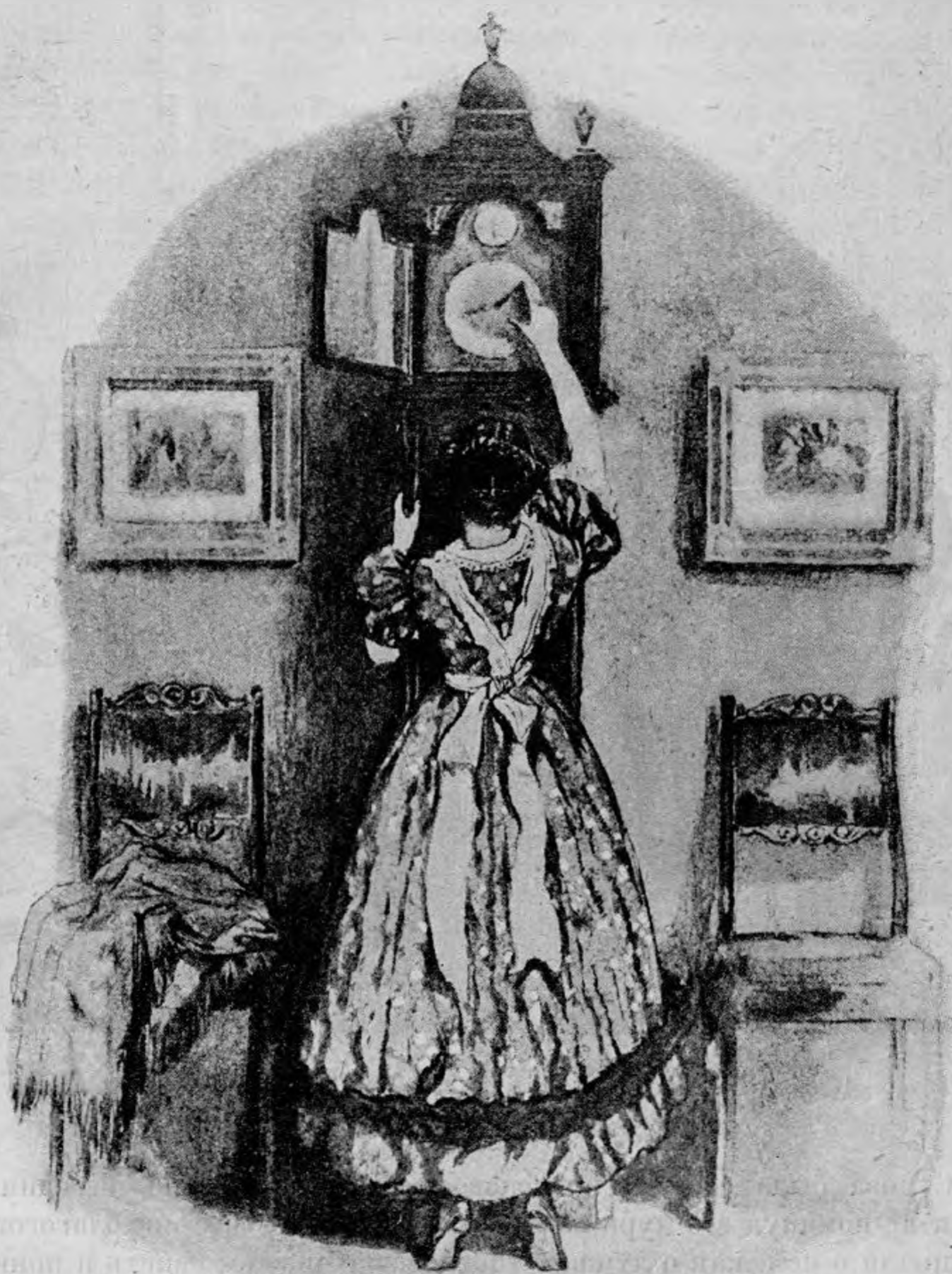
Д. Н. Кардовский.

велико, что Кардовский и Грабарь решили бросить Академию, чтобы ехать к нему в Париж учиться. Это произошло в 1896 году. Однако