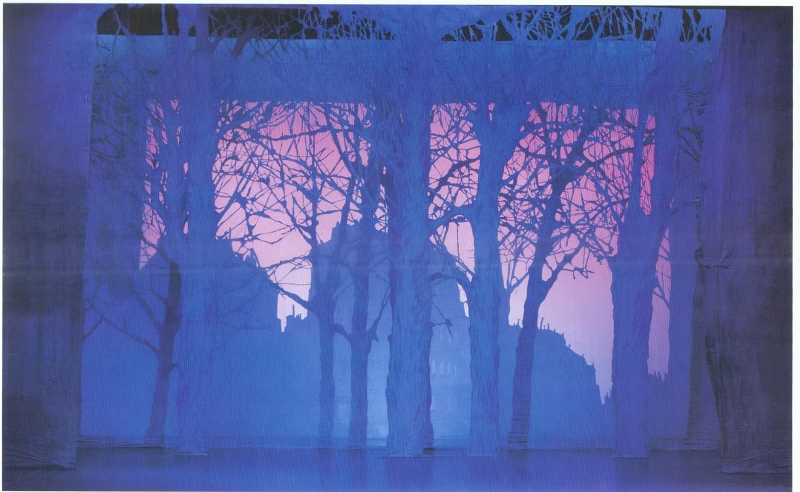
Улица ночного Парижа. Декорация спектакля