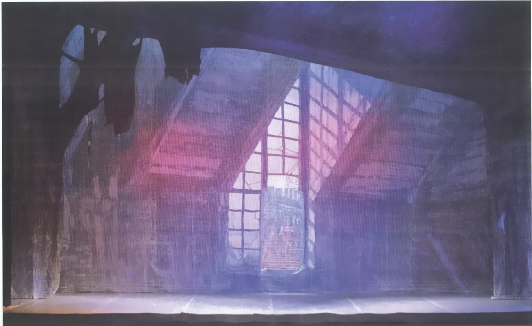
В мансарде. Декорации спектакля

В 1900 году Коровин вместе с Серовым возглавляет портретно-жанровый класс МУЖВЗ. В 1905-м по рекомендации В.Д. Поленова и В.М. Васнецова избирается действительным членом Императорской Академии художеств. Как живописец он уделяет внимание этюду.