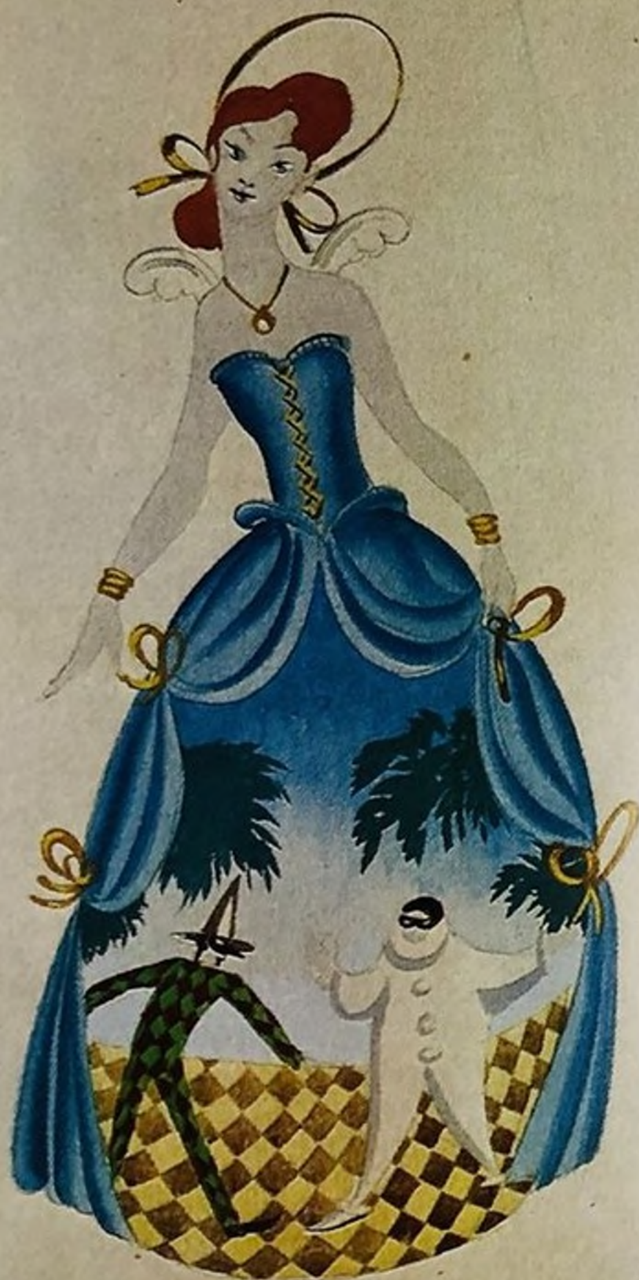
«Гень». Эскиз костюма. 1980