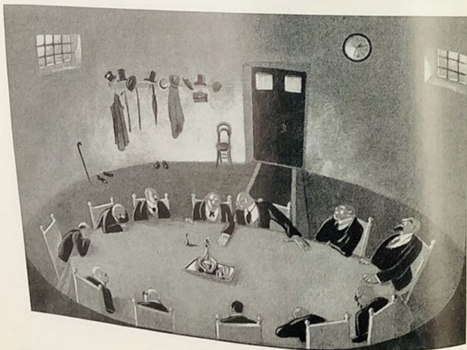
«Заговор чувств». Занавес. 1929