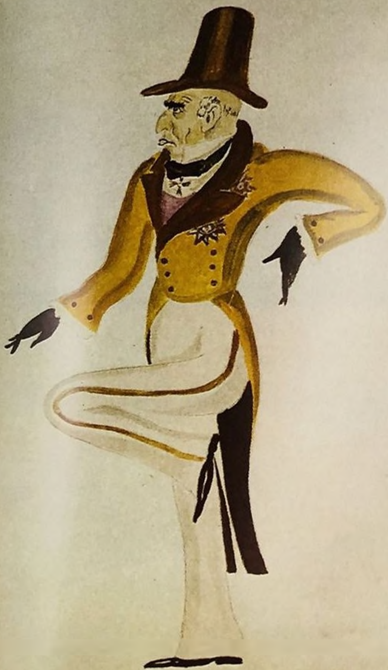
«Тень». Эскиз костюма 1960