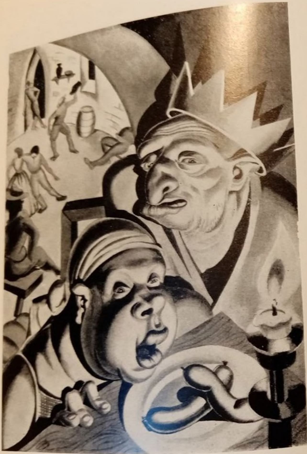
А. ДЕРЕВЬКО. СОБРАНИЕ СОЧИН. 19-ТИ Т. 1924—1927 ИЛЛЮСТРАЦИЯ