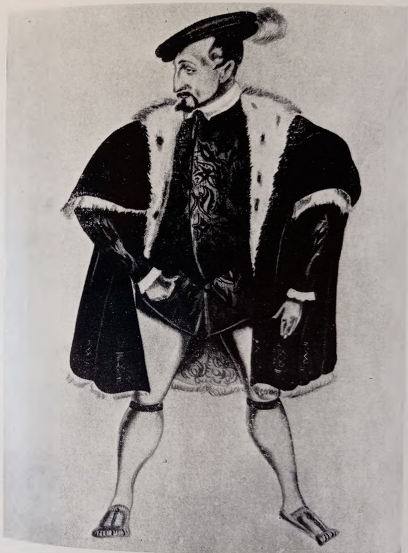
В. ШЕКСПИР. ГАМЛЕТ. 1932 ЭСКИЗ КОСТЮМА. КЛАВДИЙ