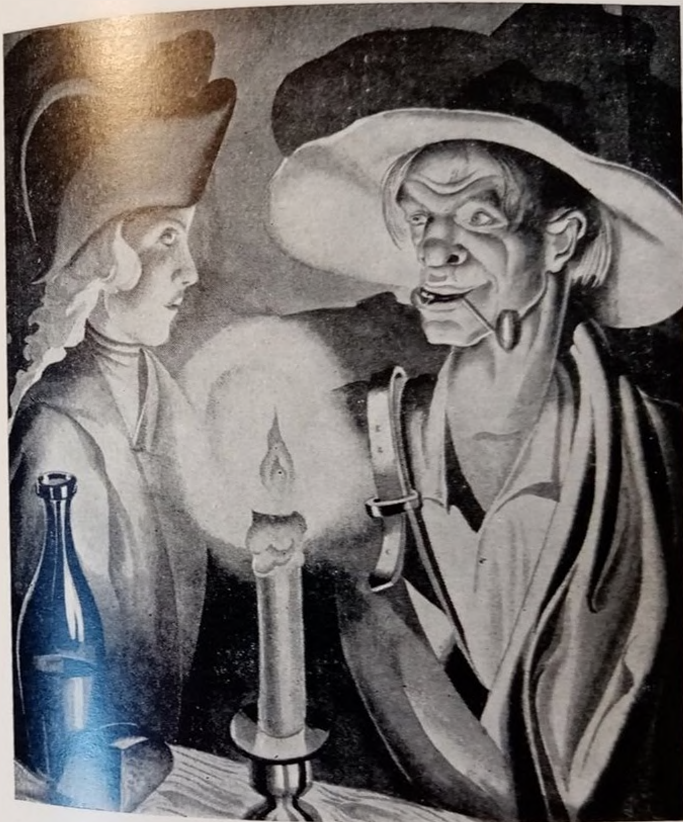
А. ДЕ РЕНЬЕ. СОБРАНИЕ СОЧИНЕНИЙ В 19-ти т. 1924—1927 ИЛЛЮСТРАЦИЯ