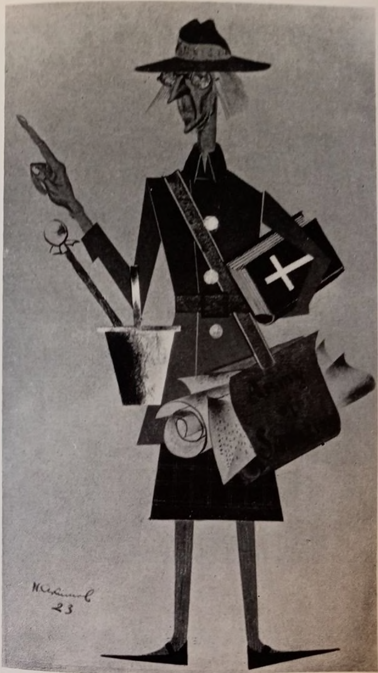
ОФОРМЛЕНИЕ ПРОГРАММЫ ЛЕНИНГРАДСКОГО ТЕАТРА-КАБАРЕ «БАЛАГАНЧИК». 1923—1924 ЭСКИЗ КОСТЮМА. «АРМИЯ СПАСЕНИЯ»